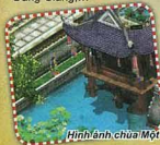
Hình ảnh chùa Một Cột trong và ngoài game