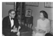
Buffett và Kay Graham, chủ bút tờ Washington Post đã bắt đầu mối quan hệ cá nhân, thân mật của họ kể từ năm 1973.