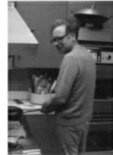
Ở nhà, Buffett luôn luôn mặc loại áo thun dài tay ưa thích của ông.