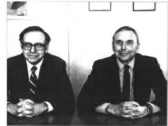
Buffett và đối tác cộng sự của ông, Charlie Munger trong những năm 1980. Buffett tự gọi họ là "một cặp song sinh dinh dưỡng".