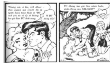
Daisy Mae Scragg, mối tình đầu của Warren thời niên thiếu. Daisy chỉ yêu một mình Lli Abner, bất kể cậu ta đối xử với cô như thế nào.

“Thế là tôi mua được mẩu xì-gà tôi muốn cho riêng tôi và tôi cố hút nó. Bạn xuống phố và bạn bắt gặp một mẩu xì-gà, đó là một mẩu xì-gà ướt đẫm, góm ghiếc và làm bạn tởm lợm, nhưng nó là của miễn phí... và có thể chỉ còn một hơi duy nhất mà thôi. Berkshire không còn mẩu nào khác như thế. Vì thế tất cả những gì bạn cần làm là đặt mẩu xì-gà ướt sũng này lên môi mình. Đó là Berkshire Hathaway vào năm 1965. Tôi đã đặt rất nhiều tiền vào trong mẩu xì-gà này. [821] Có lẽ tôi đã khăm khá hơn nếu tôi không nghe gì về Berkshire Hathaway.”