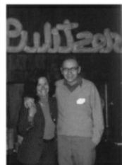
Gia đình Buffett ăn mừng nhận Giải thưởng Pulitzer, được trao tặng cho tờ Omaha Sun sau loạt bài phóng sự điều tra vụ Boys Town.