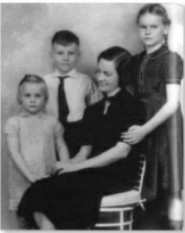
Một bức chân dung gia đình được chụp vào khoảng năm 1937.