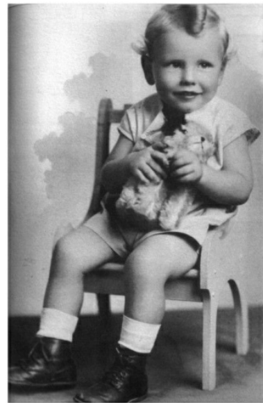
Warren Buffett năm 2 tuổi.