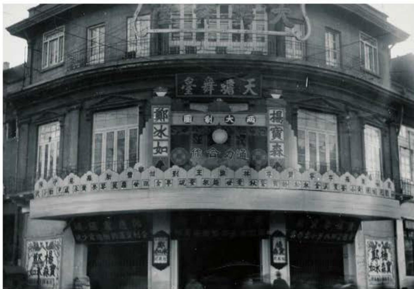
Sân khấu Thiên Thiêm ở Thượng Hải xây dựng vào năm 1925, có sức chứa 3.400 người, chuyên diễn Kinh kịch. Những vở Kinh kịch nổi tiếng như "Mai Lan Phương", "Tuần Huệ Sinh", "Mã Liên Lương", "Cái Khiếu Thiên", "Dư Trấn Phi" v.v.. đều được biểu diễn ở đây.

Bước vào thế kỉ XX, do sự xuất hiện của sân khấu mới, bố cục sân khấu được yêu thích nhất ở Trung Quốc có sự thay đổi. Năm 1908 xây dựng sân khấu mới ở Thượng Hải. Đây là sân khấu kiểu mới mô phỏng kiến trúc mới và đã trở thành trào lưu mới, trong thời gian mấy chục năm ngắn ngủi thịnh hành khắp Trung Quốc.