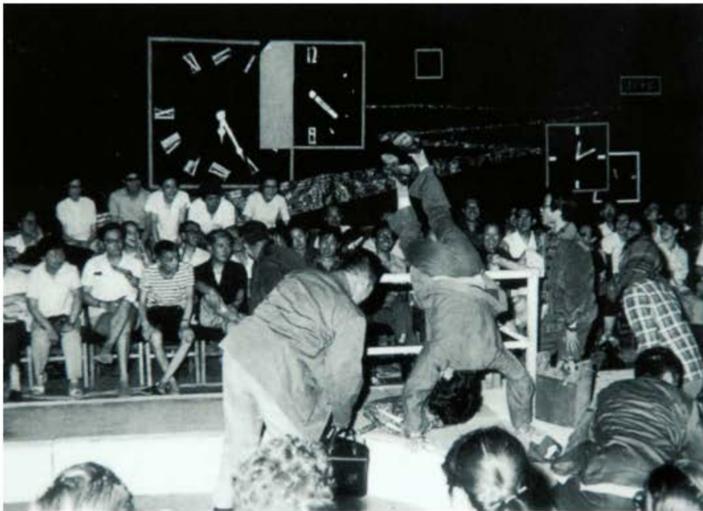
Bối cảnh diễn xuất kịch nói "Bến xe" ở sân khấu nhỏ.

Những năm cuối thập kỉ 70 của thế kỉ XX, xã hội Trung Quốc lại xảy ra biến cố lớn, cải cách mở cửa làm cho Trung Quốc phải nhìn lại truyền thống hí kịch lâu đời của mình, đồng thời phải thẳng thắn đối mặt và hòa mình với thế giới. Nghệ thuật đang nỗ lực từ bỏ những cái ràng buộc phục vụ chính trị và trở thành loa phóng thanh về hình thái ý thức, hàng loạt các tác phẩm truyền thống lại quay về với đời sống nhân dân. Việc trình chiếu lại các tác phẩm điện ảnh hí kịch như phim Việt kịch "Hồng lâu mộng", phim Hoàng mai kịch "Thiên tiên phối" v.v.. nhanh chóng thu hút người xem quay lại sân khấu. Nghệ thuật gia càng có nhiều không gian sáng tạo nghệ thuật hơn, rất nhiều hí kịch gia có sứ mệnh thời đại và sức sáng tạo nghệ thuật đã đưa những câu từ hiện thực trong đời sống vào thực tiễn sáng tác, làm cho thế giới hí kịch Trung Quốc bước vào thời kì phồn thịnh nhất từ những năm 50 của thế kỉ XX trở lại đây.