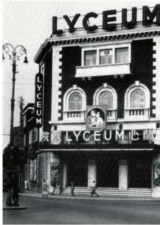
Kịch viện Lan Tâm Thượng Hải, xây dựng vào năm 1931, chủ yếu diễn xuất kịch nói và hòa nhạc.

Sân khấu mới còn thiết kế một cách hết sức mạo hiểm với sân khấu hình bán nguyệt hơi nhô ra là sự kết hợp giữa Trung Quốc và phương Tây, chính diện hơi nhô lên trên, có cảm giác như ba phương đều hướng đến khán giả. Trong khi đó, sân khấu truyền thống Trung Quốc ở trà viên có hình vuông,