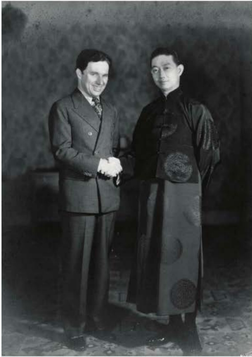
Mai Lan Phương thăm Mĩ, gặp gỡ với đại sư hí kịch Charlie Chaplin.

Năm 1927, “Thời báo Thuận Thiên” tổ chức bình chọn đào kép nổi tiếng đàn giắc lần đầu tiên ở Trung Quốc, Mai Lan Phương với kĩ thuật vững vàng, chất giọng tròn mượt, hóa trang xinh đẹp đã trở thành “tứ đại danh đán” Kinh kịch cùng với ba nghệ sĩ nữa là Trình Nghiên Thu (1904 -1958), Thượng Tiểu Vân (1900 - 1976), và Tuân Huệ Sinh (1900 - 1968).