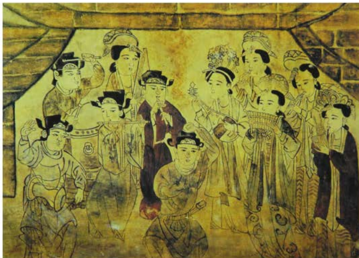
Bích họa vẽ cảnh biểu diễn vũ nhạc, được phát hiện trong một ngôi mộ đời Tống ở Hà Nam.

“Tham Quân hí” có ảnh hưởng trực tiếp đến sự hình thành của tạp kịch đời Tống - Kim. “Tham Quân hí” có nội dung chính là pha trò, làm cho người xem buồn cười, giống như biểu diễn của đào kép thời kì đầu, chủ yếu là ngẫu hứng, có thể căn cứ theo tình hình cụ thể lúc đó mà tự chế ra các màn gây cười. Hình thức biểu diễn ngẫu hứng như vậy, dần dần chuyển thành các tiết mục có nội dung tương đối cố định, từ đời Đường đến đời Tống (960 - 1279), đời Kim (115 - 1234) được tái diễn lại nhiều lần. Từ đời Tùy - Đường, kịch hài giống như “Tham Quân hí” được phát triển rất nhanh, đã sinh ra các tiết mục biểu diễn dạng như “Lộng giả phu nhân”, “Lộng bà la môn”. Đây là tạp kịch thời kì đầu Tống - Kim. Những màn kịch gây cười chủ yếu là những biểu diễn đơn giản và ngắn gọn. Ngoài hài kịch lấy lời nói, động tác để gây cười ra, còn bao gồm tạp hí kể chuyện. Tạp kịch đời Tống - Kim đã tập hợp và cung cấp