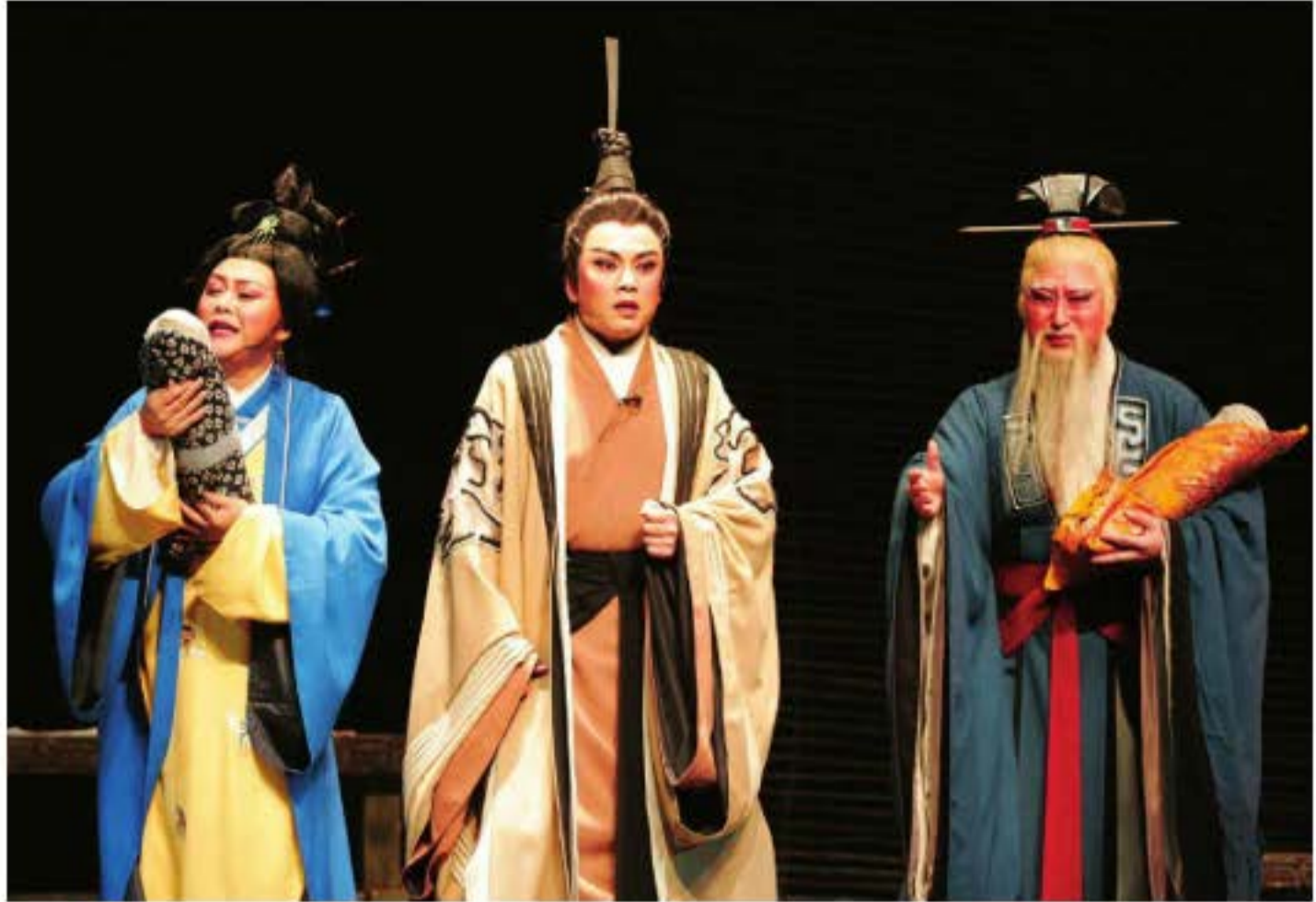
Kịch "Triệu Thị Cô Nhi" được Việt kịch biểu diễn ở Viện kịch Việt Thượng Hải.