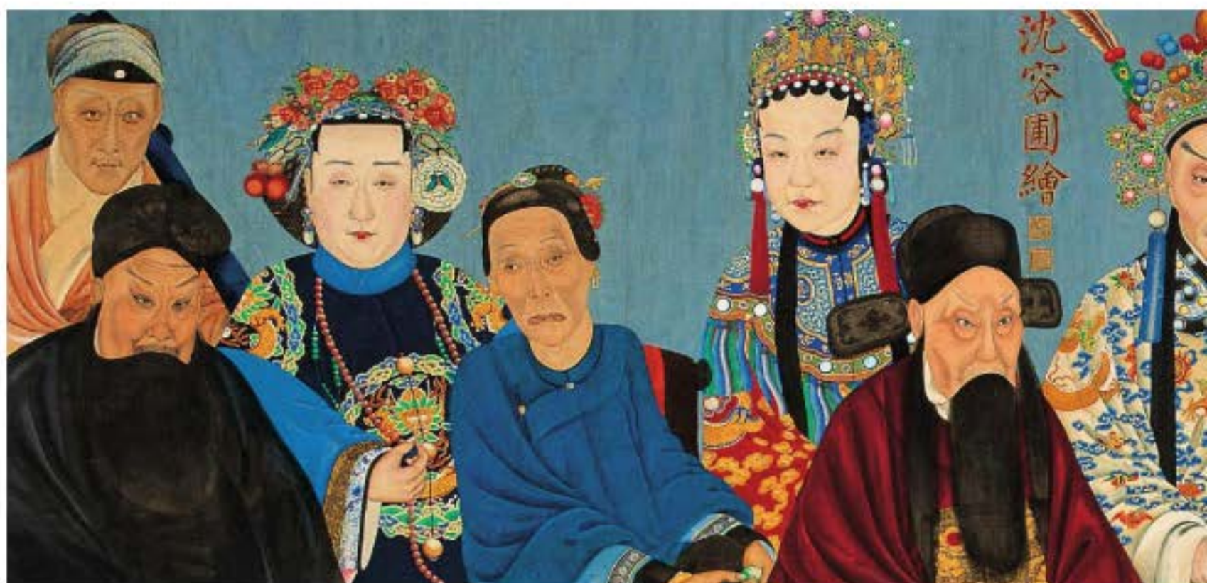
"Đồng Quang thập tam tuyệt" (Tranh của Thẩm Dung Phố), bức tranh miêu tả mười ba diễn viên Kinh kịch nổi tiếng thời Quang Tự và Đồng Trị triều đại nhà Thanh, mỗi một vị đều có bí quyết biểu diễn riêng.

thậm chí có thời gian biểu diễn còn dài hơn nữa, diễn xuất cả vở kịch có tính hoàn thiện về kết cấu nội dung bên trong. Nhưng Kinh kịch lại không giống như vậy. Kinh kịch kế thừa chế độ diễn xuất của Côn khúc, bắt đầu từ khi hình thành đã lấy biểu diễn "triết tử hí" (trích đoạn) làm chính. Bất luận biểu diễn trong cung hay trong dân gian, bất kể thời gian diễn xuất là buổi chiều hay là buổi tối, trong một đơn vị thời gian, sân khấu liên tục biểu diễn năm sáu cho đến vài chục "triết tử hí", mà không phải biểu diễn một vở kịch lớn.