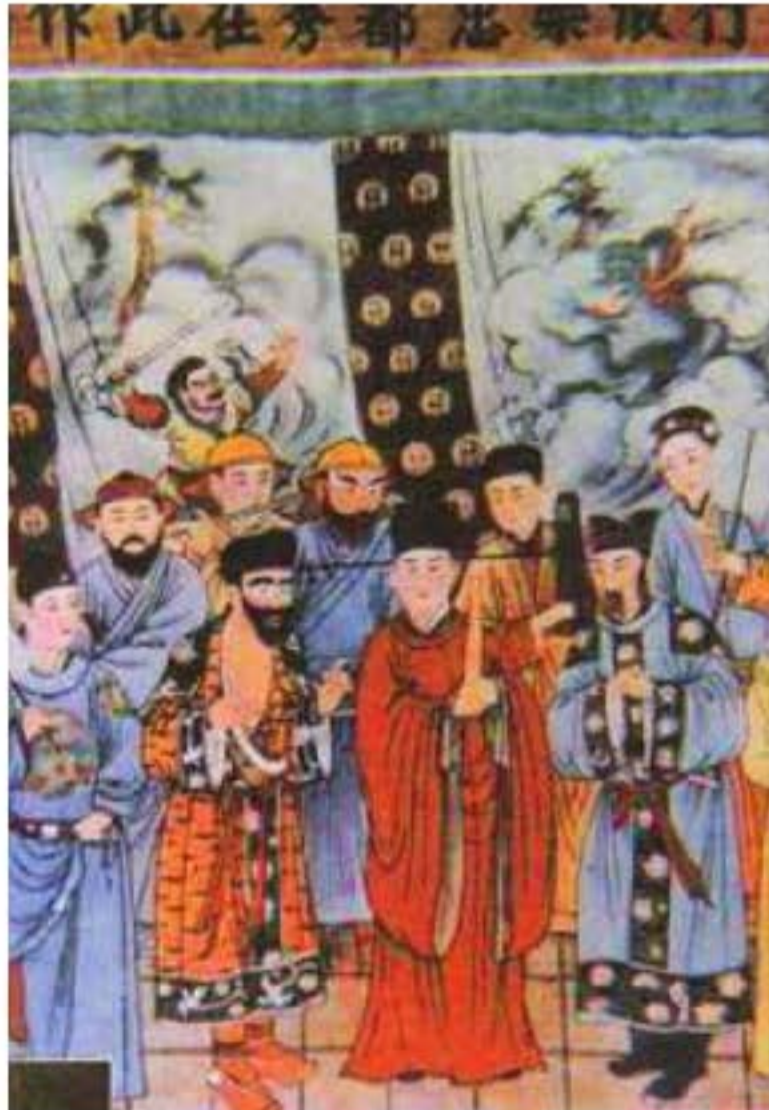
Bích họa ở chùa Quảng Thắng huyện Hồng Động tỉnh Sơn Tây, thể hiện cảnh diễn xuất tạp kịch đời Nguyên.

Hí văn được gọi là "Nam khúc hí văn", tạp kịch đời Nguyên được gọi là "Bắc khúc tạp kịch". Từ nhà Tống đến nhà Nguyên, âm nhạc và hí kịch hai miền nam bắc Trung Quốc có sự khác nhau rõ rệt. Tuy nhiên tạp kịch đời Nguyên không phải xuất hiện do ảnh hưởng của kịch văn, âm nhạc của tạp kịch đời Nguyên rõ ràng, rành mạch, không giống