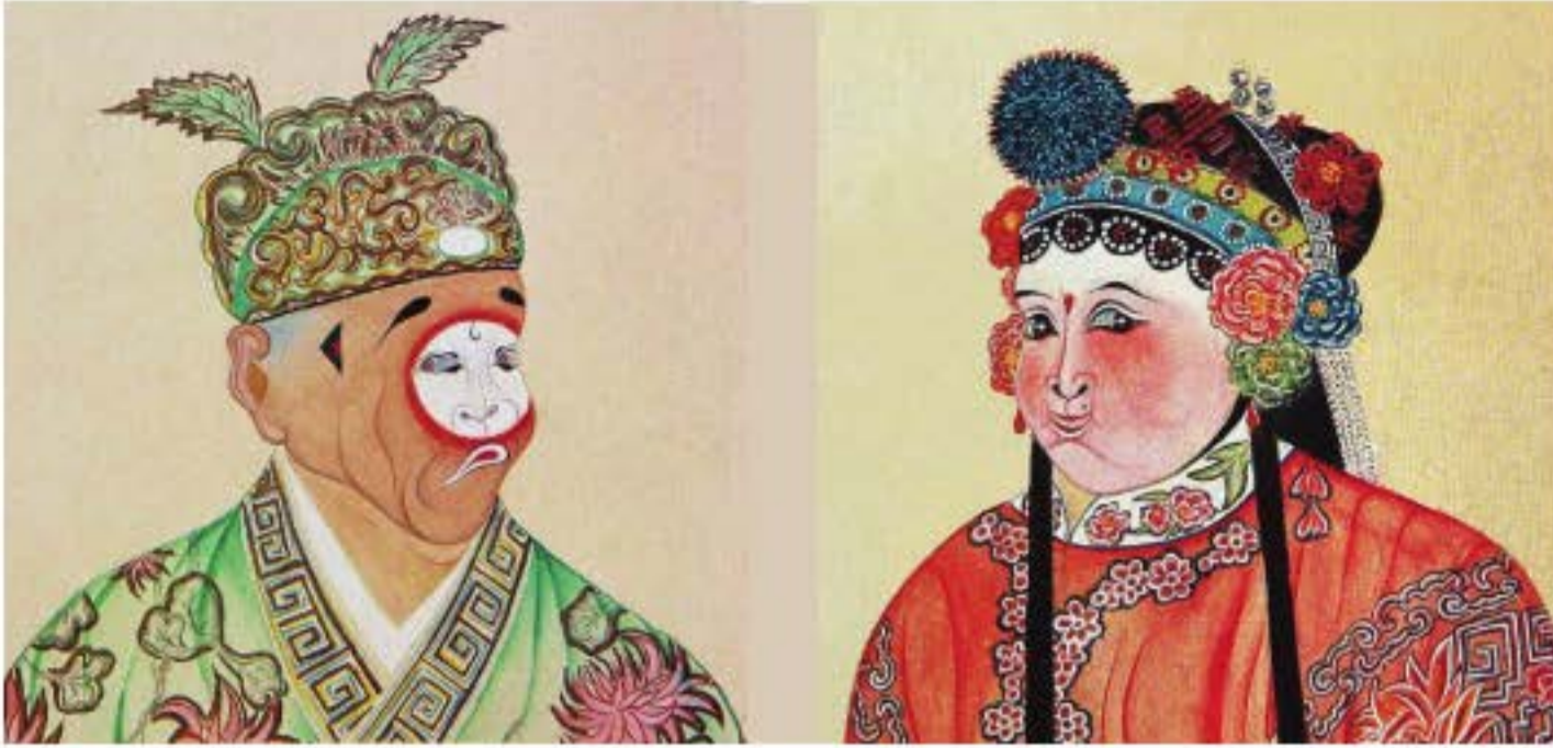
Nam Sầu, nữ Sầu (nam xấu, nữ xấu). (Trương Kim Lương vẽ)

đồng thời xuất hiện trên sân khấu, anh ta có thể kiêm diễn tất cả các nhân vật hí kịch trong vở diễn. Trong vở kịch “Trương Hiệp trạng nguyên”, ba diễn viên mặt, tịnh, sầu đều xuất hiện với tần số cao, trong các màn khác nhau thì kiêm đóng các nhân vật hí kịch khác nhau.