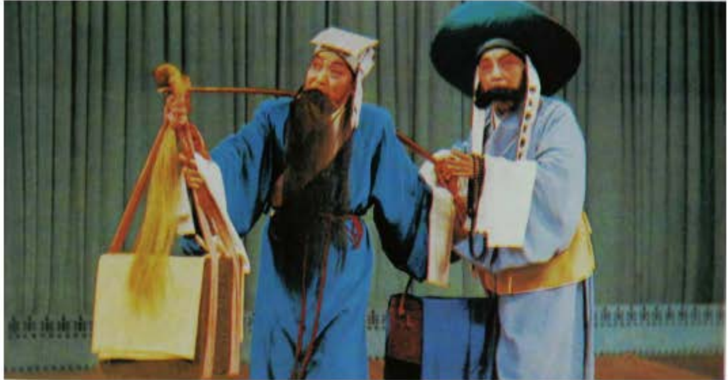
Còn khúc "Thiên trung lục", Du Chấn Phi đóng Kiến Văn Đế.

nhiều đoạn như "Thẩm đầu", "Thích Thang" v.v.. vẫn được biểu diễn trên sân khấu ngày nay, được mọi người yêu thích.