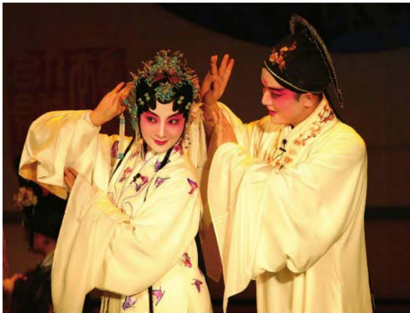
Còn khúc "Mẫu đơn đình", Đoàn côn kịch Tô Châu biểu diễn.

"Mẫu đơn đình" tình tiết li kì, nhưng cái làm cho người ta tán dương nhất chính là sự chết đi sống lại của Đỗ Lệ Nương. Thiếu nữ đương xuân, hoài cảm thiên địa mà có giấc mơ kì lạ, tình lang trong giấc mơ là hư ảo, nhưng không ngờ rằng người mà cô gặp trong mộng lại chính là chàng thư sinh đưa cô từ dưới đất lên sau ba năm không còn ở dương thế. Đỗ Lệ Nương chết vì tình lang trong mộng, nhưng hoàn sinh cũng là do tình lang của nàng quá đổi nặng lòng. Đoạn chuyện thấm đẫm tính ly kì giữa giới hạn của sống và chết, vượt ra ngoài sự tưởng tượng của mọi người. Thang Hiến Tổ dùng văn từ để thể hiện đoạn tình cảm này, có thể nói chữ nào cũng đắt giá, ví dụ như ca từ viết về tiểu thư khuê các Đỗ Lệ Nương đương tuổi xuân thì sống trong khuê các như sau: