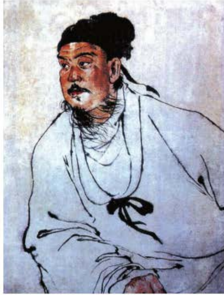
Tranh vẽ Quan Hán Khanh

nhưng vô cùng phóng khoáng. Ông từng tuyên bố rằng: “Tôi là lang quân lãnh tụ khắp thiên hạ, là ngọn sóng lớn phủ khắp thế giới”. Thậm chí ông còn kiêu ngạo nói rằng: “Tôi là một hạt đậu bằng đồng, hấp không nừ, nấu không chín, đập không bẹp, xào không cháy”. Lúc đương thời, giới biểu diễn nghệ thuật gọi ông là “Lãnh tụ Khu Lê Viên, tổng biên tập và chỉnh sửa kịch, người đứng đầu biểu diễn tạp kịch”. Điều này cho thấy được địa vị rất cao của ông trên diễn đàn kịch đời Nguyên.