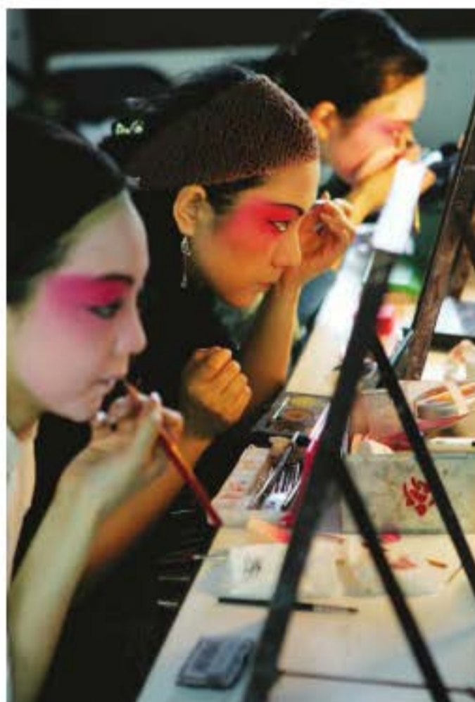
Trong hậu trường, diễn viên hí kịch đang hóa trang, chuẩn bị diễn xuất một vở kịch hay với gương mặt trang điểm đậm.

Bốn hình thức biểu diễn cơ bản của hí kịch Trung Quốc là “xướng, niệm, tác, đả”. Những hình thức biểu diễn này dựa trên nguyên tắc hư cấu (như lên lầu, diễn viên chỉ cần làm động tác vén áo, nhắc chân; đóng mở cửa, trên sân