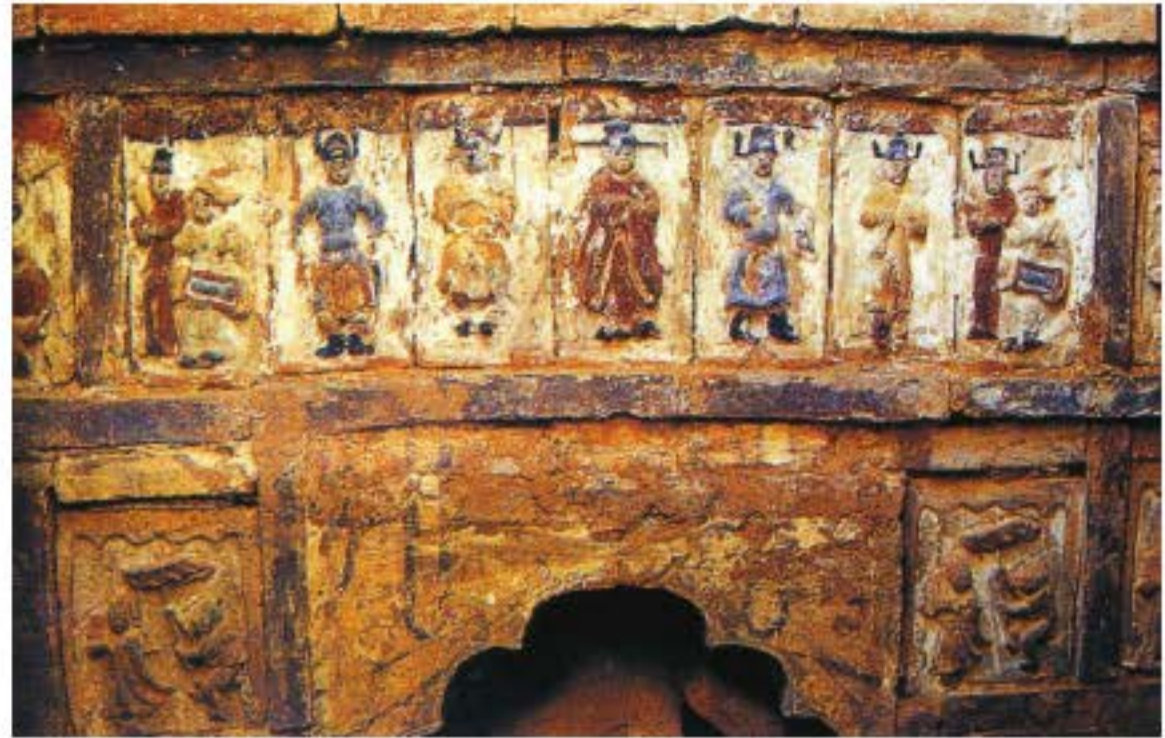
Truyện tạp kịch được khắc trên mộ ở Tắc Sơn, Sơn Tây hình tượng sắc thái biểu cảm của các nhân vật tạp kịch được khắc họa rõ nét.