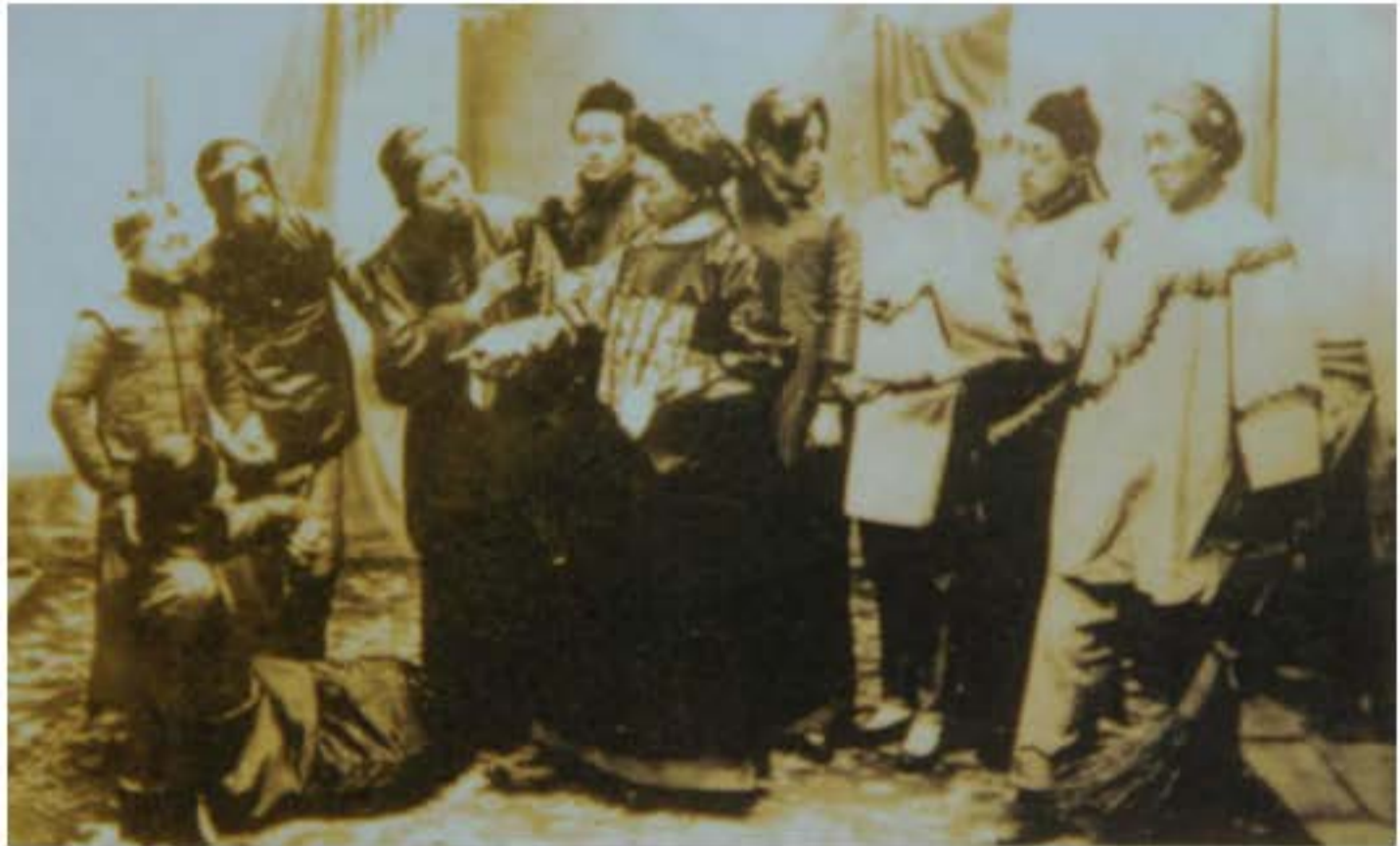
Năm 1913, Tân dân xã diễn xuất kịch mới "Ổ gia đình".