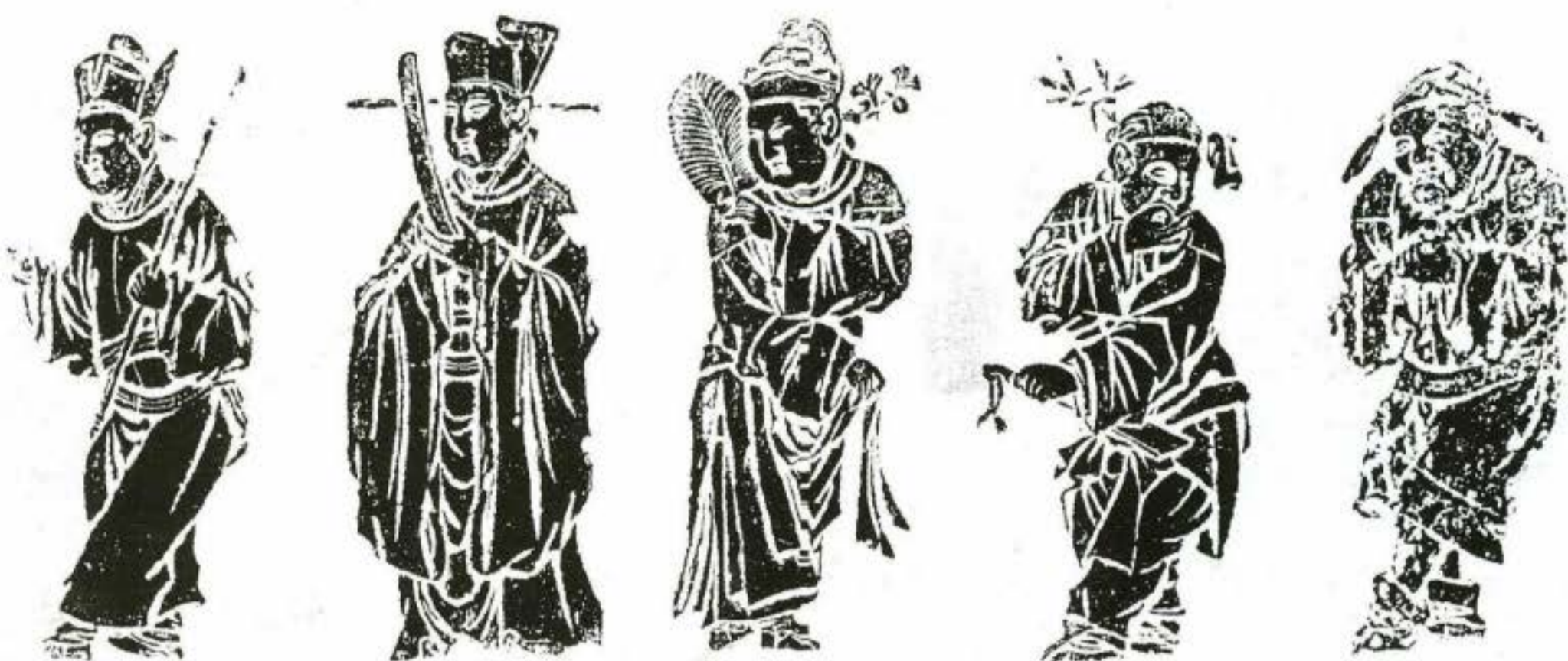
Nhân vật hí kịch khắc họa trên gạch đời nhà Hán.

như hát kiêu “Nhị nhân chuyến” sau này, được hoàn thành bởi một vai nam, một vai nữ. Vai nam thường vừa hát, vừa múa, đôi khi còn lồng thêm lời thoại.