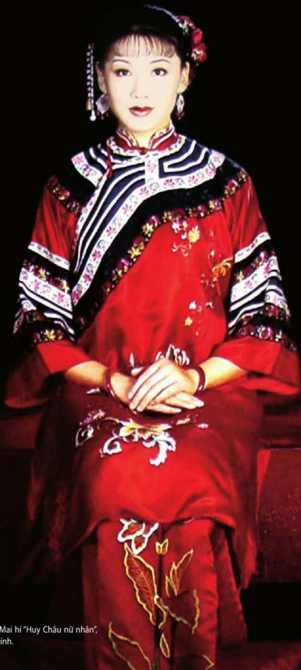
Vở kịch mới Hoàng Mai hí "Huy Châu nữ nhân", Hàn Tái Phần diễn chính.