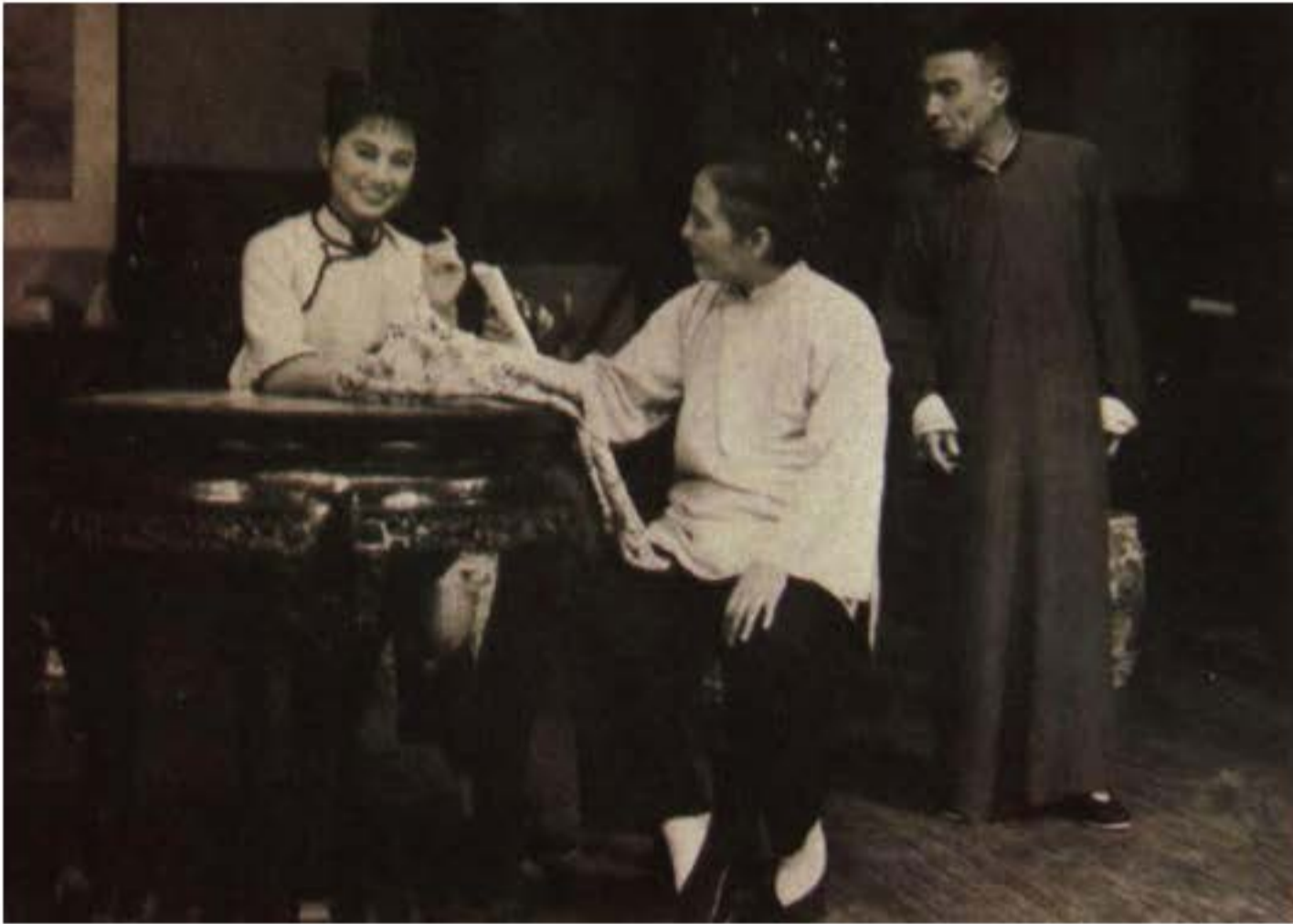
Ảnh kịch "Lôi vũ".

kịch phương Tây đồng thời thực sự am hiểu về kịch phương Tây. Dưới sự nỗ lực của họ, đặc điểm nghệ thuật và phương pháp biểu diễn cũng như cơ sở lí luận của hình thức hí kịch thường thấy ở phương Tây - "kịch nói" mới thực sự cắm rễ sâu và phát triển ở Trung Quốc.