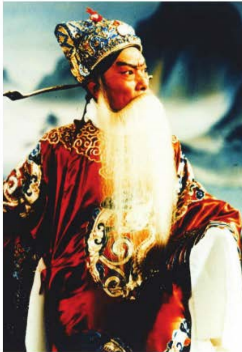
Ảnh Kinh kịch “Triệu Thị Cô Nhi”.

Tác phẩm đời Nguyên còn có ảnh hưởng nữa phải kể đến “Triệu Thị Cô Nhi” của tác giả