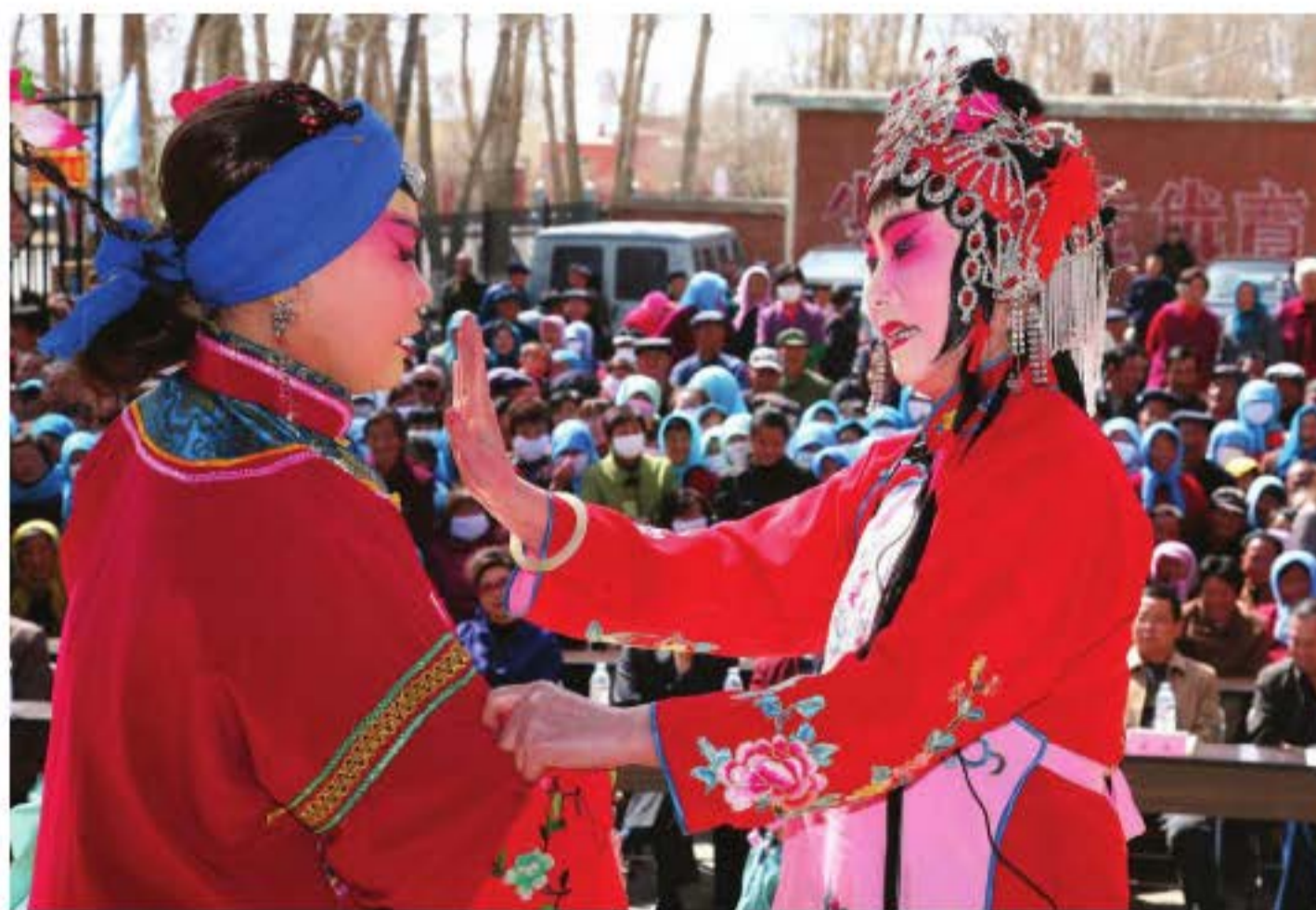
Biểu diễn Tần xoang ở nông thôn, náo nhiệt tràn đầy sức sống.

Tần xoang trở thành hình thức kịch trường thành và độc lập, lưu truyền nhanh chóng khắp các vùng với tên gọi là “Bang tử”. Sự truyền bá của Tần xoang, một phần là do cuộc khởi nghĩa của Lí Tự Thành. Lí Tự Thành dẫn quân khởi nghĩa vào năm Sùng Trinh thứ hai đời Minh (1629), đến năm thứ 17 (1644) thì tiến vào Bắc Kinh, lật đổ triều nhà Minh. Chủ lực của đội quân Lí Tự Thành chính là tướng sĩ xuất thân từ nông dân ở Thiểm Tây, nghe nói quân đội của ông lấy Tần xoang làm quân kịch, do vậy rất nhiều nghệ sĩ Tần xoang theo khởi nghĩa quân chiến đấu khắp các vùng. Những nơi mà khởi nghĩa quân đến, mỗi lần chiến thắng thì đều mở tiệc mừng bằng biểu diễn Tần xoang ở miếu làng địa phương. Sau khi khởi nghĩa quân thất bại, nghệ sĩ Tần xoang đi theo quân lính tản mát khắp nơi, làm cho Tần xoang nhanh chóng truyền bá đi khắp các vùng. Trong quá trình truyền bá, Tần xoang kết hợp với âm nhạc dân gian địa phương, đặc điểm chất giọng của mõ hoà hợp lẫn với chất giọng địa phương, sản sinh ra hình thức kịch “Bang tử” mới. Cả nước Trung Quốc đã hình thành rất nhiều đoàn kịch “Bang tử” có quy mô lớn. Giống như Cao xoang, do khác xa với xu hướng phong cách âm nhạc côn khúc, lại có đặc điểm âm nhạc dễ được quần chúng nhân dân tiếp nhận nên “Bang tử” trở thành hình thái kịch có sức ảnh hưởng lớn trong thời Minh Thanh.