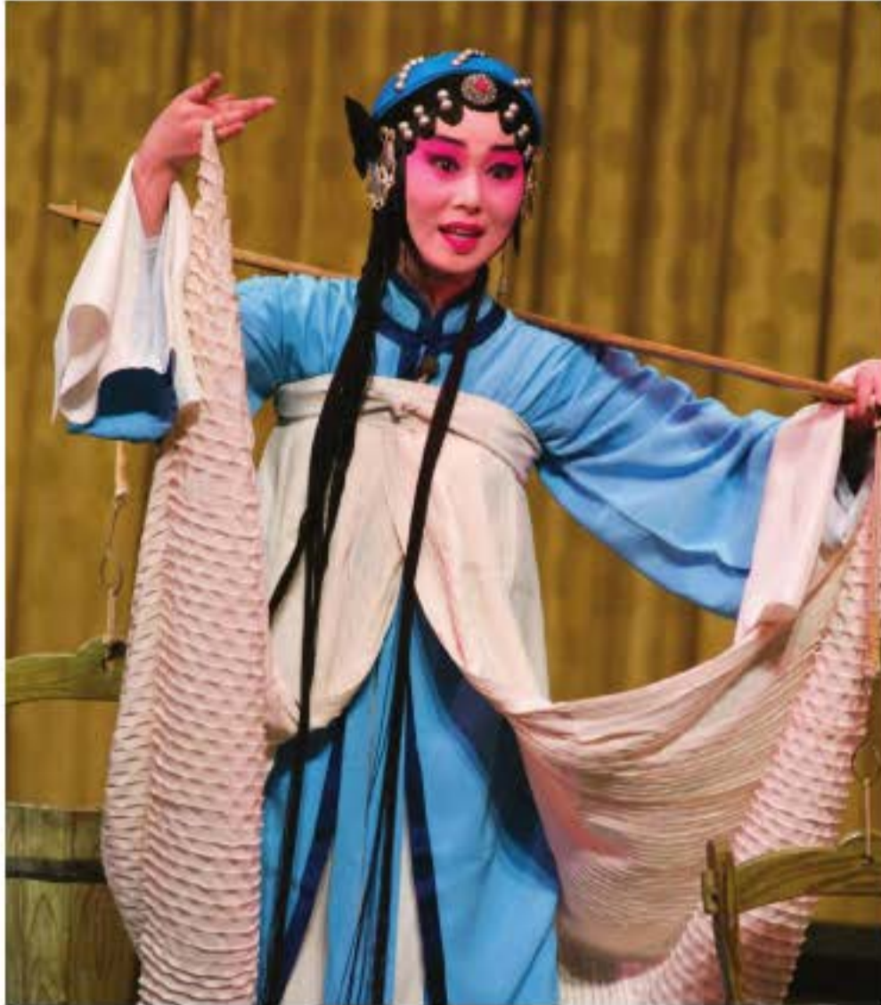
Côn khúc "Cán Sa kí", đoàn côn kịch phương Bắc biểu diễn.

nhạc diễn tấu trong cung đình chuyển sang côn khúc, là sở thích của tầng lớp đại phu, sĩ nông. Từ giữa triều đại nhà Minh, sự tồn tại và phát triển của Côn khúc và ý nghĩa của nó đã vượt xa lĩnh vực hí kịch và âm nhạc, dần dần trở thành tượng trưng cho văn hóa nhã nhạc của dân tộc Trung Hoa.