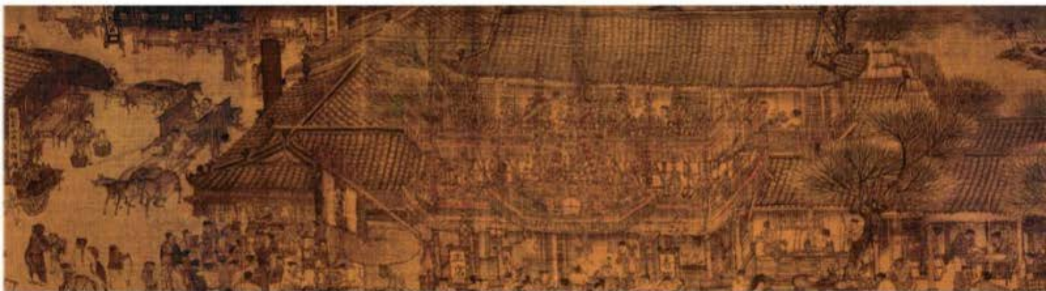
Bắc Tống “Thanh Minh thượng hà đồ” (bố cục), miêu tả cảnh sầm uất của Biện Lương, kinh thành thời Bắc Tống, phía bên trái bức tranh còn có một nhà hát bên đường.

Nhìn từ góc độ văn thể, nó tương đối gắn gũi với kịch bản. Mà càng giống hơn chính là “Chư cung điệu” (điệu hát kê), một thể loại có liên quan rõ ràng đến biến văn.