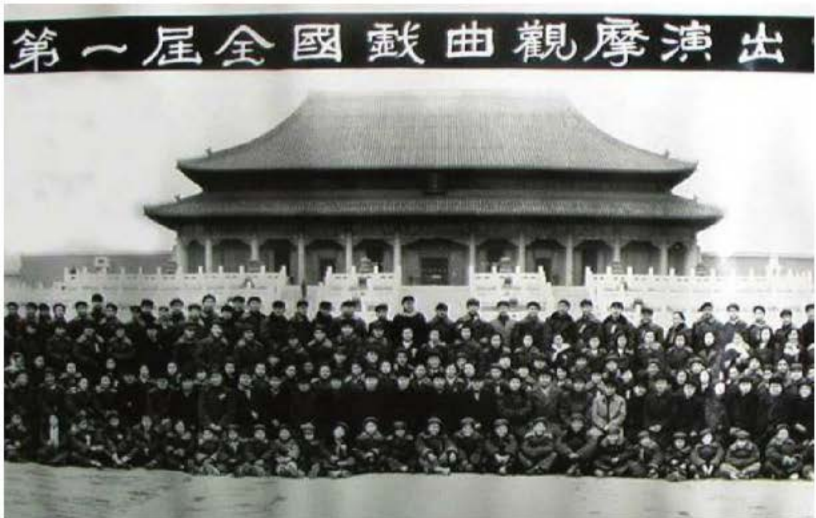
Năm 1952, chụp ảnh lưu niệm Hội diễn học hỏi kinh nghiệm hí kịch toàn quốc lần thứ nhất.