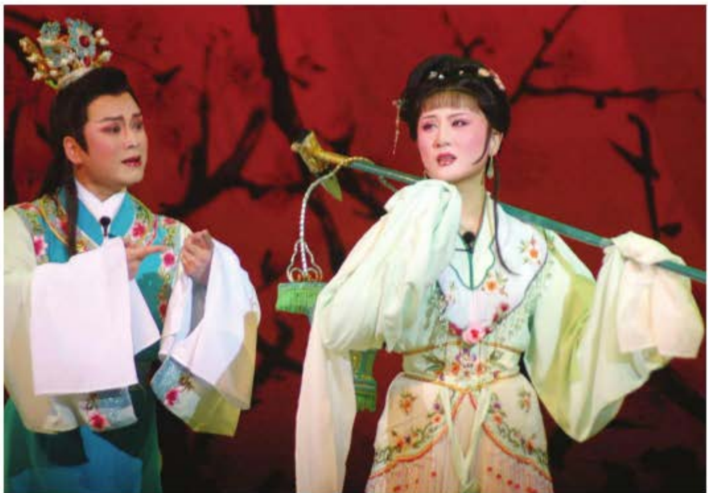
Ảnh kịch tác phẩm Việt kịch kinh điển “Hồng Lâu Mộng”.

“Hà Văn Tú” là tác phẩm kịch truyền thống của Việt kịch, viết về tú tài Hà Văn Tú bị gian thần Nghiêm Tung hãm hại, toàn gia gặp họa, chỉ có Hà Văn Tú chạy thoát, mưu sinh bằng nghề hát Đạo tình (hình thức diễn xuất lấy hát làm chính, đệm bằng trống và phách, chuyên diễn các tích của Đạo giáo). Con gái gia đình họ Vương giàu có là Vương Lan Anh nhìn thấy anh ta thân thể đáng thương, lại có chút tài mạo nên đã lén lút hò hẹn với anh chàng và thành thân. Nhưng không được nhà họ Vương chấp nhận đành đưa nhau trốn đến vùng Hải Ninh, không ngờ lại bị phú hộ địa phương Trương Đường hãm hại, làm cho vợ chồng phân li mỗi người mỗi ngả. Hà Văn Tú lại tháo chạy lần nữa, Vương Lan Anh được bà Dương mở quán trà cứu sống. Màn đặc sắc nhất của câu chuyện là những hồi như “Tang viên phỏng thê”, “Khốc bài”, “Toán mệnh”. Hà Văn Tú hai lần gặp nạn được cứu, nghe ngóng được nơi ở của thê tử, đúng lúc nàng đang cúng giỗ tròn ba năm của chàng. Do Trương Đường chưa bị