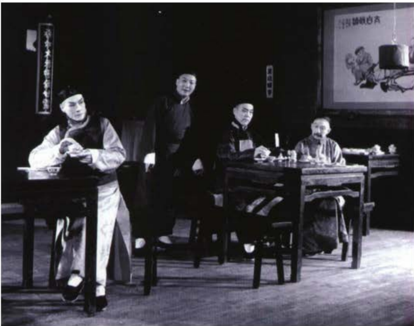
Ảnh chụp biểu diễn “Trà quán” lần đầu tiên (năm 1958).

Từ thập kỉ 50 của thế kỉ XX, sử dụng như thế nào hình thức hí kịch truyền thống để biểu diễn những đề tài kịch hiện đại luôn luôn là vấn đề quan trọng mà chính phủ và các nhà nghệ thuật vô cùng quan tâm.