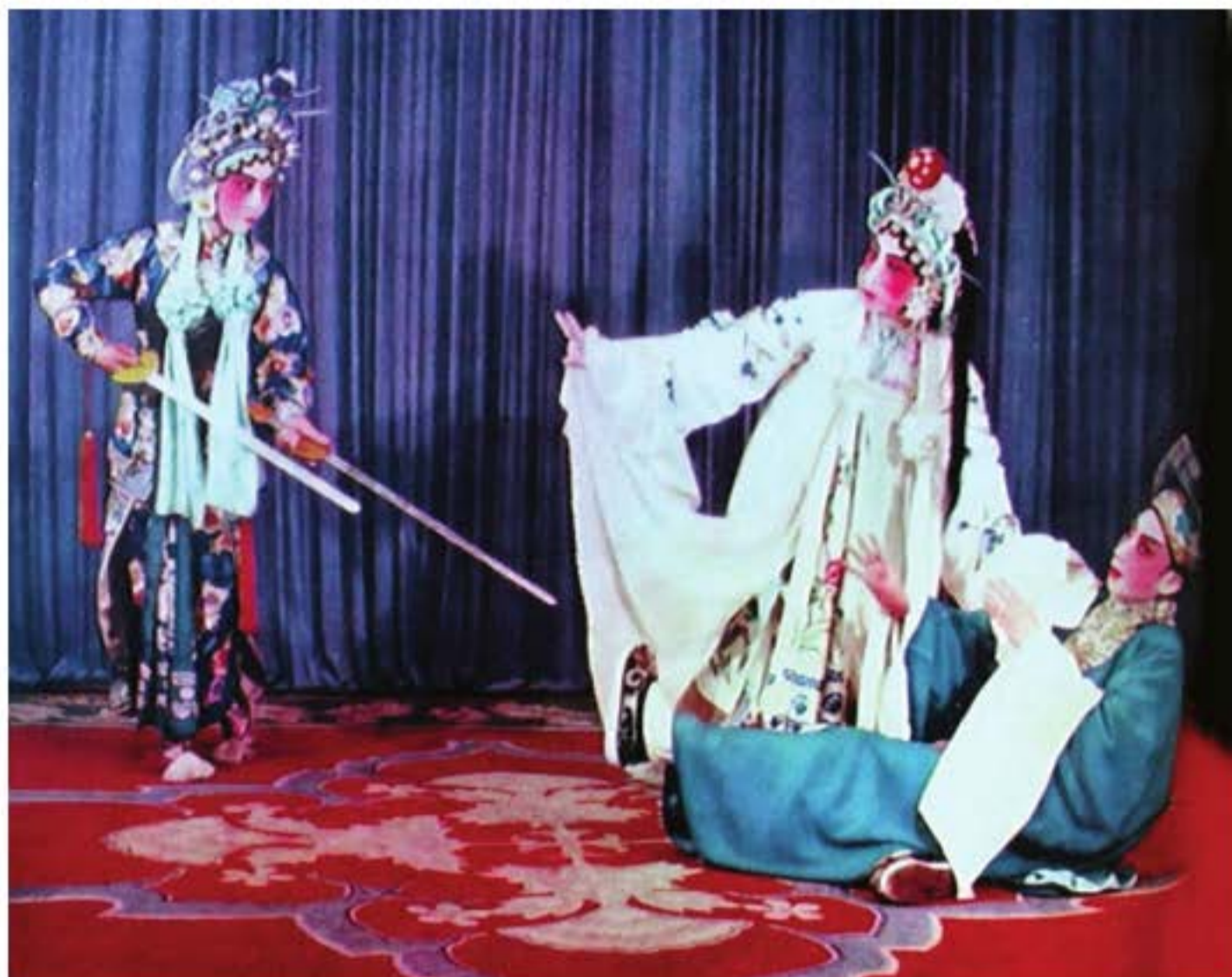
Ảnh kịch “Đoạn kiều” (Sở kịch). “Đoạn kiều” có đề tài từ truyền thuyết dân gian “Bạch xà truyện”, chủ yếu kể lại câu chuyện tình giữa xà yêu Bạch Tố Trinh và anh chàng thư sinh Hứa Tiên.

tương truyền trong dân gian, trong đó đa phần có nguồn gốc từ thể tự sự được lưu truyền trong dân gian như hình thức thoại bản, bảo quyền (một loại văn hát nói, kể chuyện xen với hát) v.v.. Ví dụ các tác phẩm “Trần Châu tháp”, “Mại bà kí”, “Tương mại bản”, “Mại thanh than”. đều là những xướng thư dài được lưu truyền đã lâu. Những kịch bản này đa phần có thể diễn vài ngày, thậm chí những tác phẩm dài có thể diễn vài tháng. Sau này nó trở thành nguyên mẫu kịch bản Việt kịch, thậm chí có thể diễn xuất đến tận bây giờ. Trong quá trình diễn xướng đồng thời còn hình thành nên kết cấu âm nhạc cơ bản, có huyền luật và tiết tấu thuận miệng dễ hát, vui tai dễ nghe, trình độ biểu diễn của nghệ sĩ không ngừng được nâng cao. Tết xuân năm 1906, được phú hộ và nông dân yêu cầu, một số nghệ sĩ xướng thư ở Thặng huyện đã hóa trang, mặc trang phục các vai diễn, mang nội dung xướng thư lên sân khấu biểu diễn ở một số vùng như Dư Hàng và Lâm An Chiết Giang, hoàn tất quá trình chuyển hóa quan trọng từ xướng thư sang hí kịch biểu diễn trên sân khấu. Do khi biểu diễn không dùng nhạc cụ hơi, dây, mà chỉ dùng trống da và một cái phách, phát ra âm thanh “đích đốc”, do vậy được nông dân các vùng gọi là “Gánh hát Đích đốc”. Trên cơ sở “Gánh hát Đích đốc” đã phát triển một loại hình kịch mới sau này, đó là kịch Việt (Việt kịch).