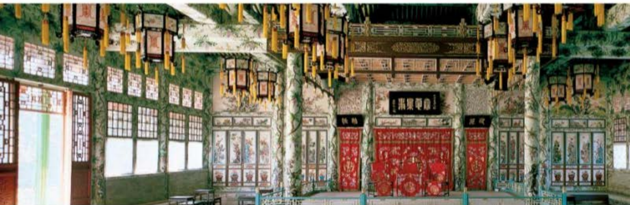
Sân khấu kịch lớn trong Cung Vương phủ. Cung Vương phủ được xây vào năm 1777, là vương phủ có quy mô lớn nhất còn tồn tại ở Bắc Kinh, hí lấu trong phủ chiếm diện tích khoảng 700m 2 .

Chế độ diễn xuất độc đáo của Kinh kịch có tác dụng tích cực trong việc nâng cao trình độ biểu diễn và sự trưởng thành của Kinh kịch. Kinh kịch cũng lấy diễn xuất “triết tử hí” làm chính, hoàn toàn không giống với chế độ biểu diễn thường thấy của các hình thức kịch khác ở Trung Quốc. Thời kì trưởng thành đầu tiên của hí kịch Trung Quốc, Tống - Nguyên Nam hí và tạp kịch đời Nguyên đã lần lượt hình thành và hoàn thiện hệ thống kịch bản, thời gian diễn xuất một vở kịch từ ba bốn tiếng đồng hồ đến năm sáu tiếng đồng hồ,