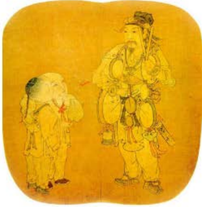
Tranh "Tạp kĩ hí hài đồ" đời Tống, trong tranh là nghệ nhân tạp kĩ: miệng thì hát tay thì gõ trống và hai đứa trẻ bị cuốn hút bởi nghệ thuật tạp kĩ.

rất nhiều tài liệu biểu diễn cho hí kịch. Về sau, khi hí kịch đã được định hình, những hình thức biểu diễn ngắn gọn hàm súc này được lồng vào những vở kịch có quy mô lớn, đã trở thành một bộ phận vô cùng sinh động.