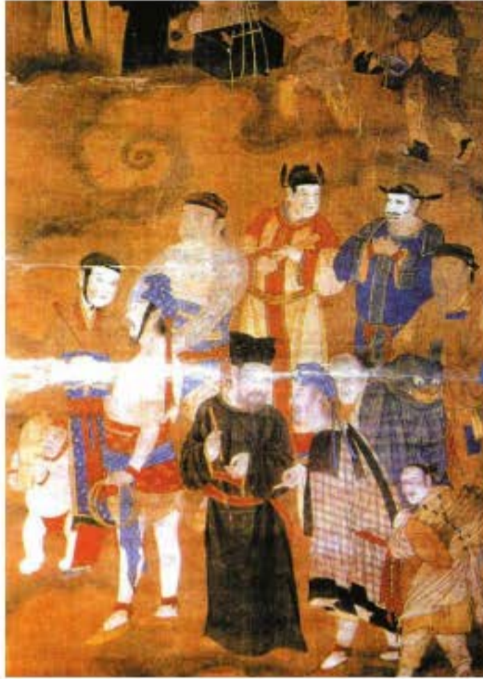
Tranh Thủy Lục ở chùa Bảo Ninh huyện Hữu Ngọc tỉnh Sơn Tây, thể hiện cảnh nhóm kịch mang đạo cụ, nhạc cụ trên đường biểu diễn.

như âm nhạc hí văn tùy hứng và tản mạn. Tuy đều được gọi là “tạp kịch”, nhưng tạp kịch đời Nguyên cũng không phải là sự phát triển của tạp kịch đời Tống - Kim. Tạp kịch đời Tống - Kim có chủ thể là trào phúng, gây cười, âm nhạc cũng chỉ là thứ yếu, có thể có, có thể không, độ dài của tác phẩm ngắn, không có tình tiết câu chuyện hoàn chỉnh. Tuy nhiên, nhạc vũ, tạp kịch và hát nói, tiểu kịch trào phúng đời Tống - Kim thường được quy vào tạp kịch đời Nguyên, đặc biệt khi đổi cảnh thì được xuất hiện bằng hình thức kịch trong kịch, hoặc có sự điều chỉnh bằng một vở kịch ngắn ở giữa, đôi khi cũng được dùng để lấp khoảng trống khi diễn viên thay vai diễn.