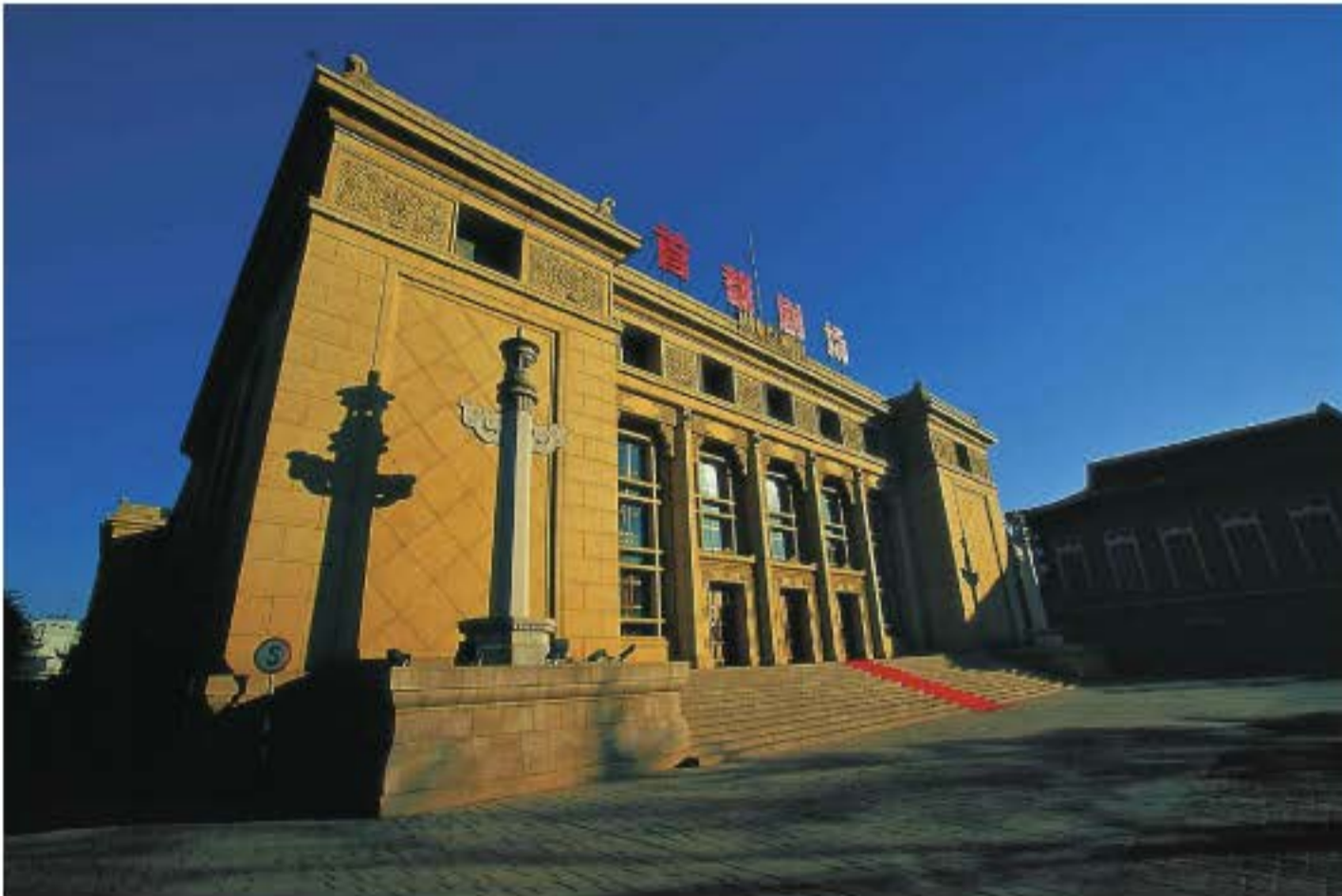
Sân khấu thủ đô được xây dựng vào năm 1954, là sân khấu biểu diễn kịch nói chuyên nghiệp đầu tiên ở Bắc Kinh, đến nay vẫn là thánh địa của những người mê kịch nói.

Âm nhạc của “dạng bản hí” không hoàn toàn thoát khỏi âm nhạc truyền thống Kinh kịch, nhưng vì nó nhấn mạnh nhiều đến việc vận dụng âm nhạc hí kịch để các tác phẩm viết về nhân vật anh hùng có thể hát thành một liên khúc có trình tự, đồng thời