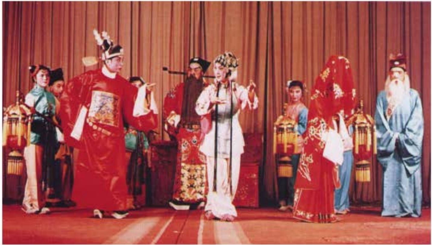
Ảnh chụp Cao xoang Xuyên kịch "Phấn Hương kí".

Nó chủ yếu dựa vào sức mạnh thanh âm tự nhiên của con người thể hiện tình cảm mang tính hí kịch. Hình thái âm nhạc hí kịch kiểu này tất nhiên có thể kích thích sự thể hiện tình cảm âm thanh con người ở mức độ cao nhất. Tuy nhiên nguyên nhân của nó cũng có thể là vì biểu diễn hí kịch dân gian giữa đời Minh vẫn ở vào trạng thái mộc mạc, chưa có sự kết hợp hoàn hảo giữa thanh nhạc và khí nhạc. Những câu chuyện mà điệu Dục Dương biểu diễn thường coi trọng nhân hiếu tiết lễ, thanh điệu khảng khái cao vang, làm cho người nghe hưng hực khí thế. Phong cách của nó hào phóng, mạnh mẽ, nhanh, không khí diễn xuất sôi nổi, làm cho người xem bình dân vô cùng thích thú. Ở các vùng nông thôn, hí kịch thường được biểu diễn ở sân miếu, đền lộ thiên, không gian khoáng đạt, bố trí sơ sài, hình thức kịch dân gian mà đại diện là điệu Dục Dương càng thích hợp với khả năng diễn xuất của nghệ sĩ hí kịch dân gian.