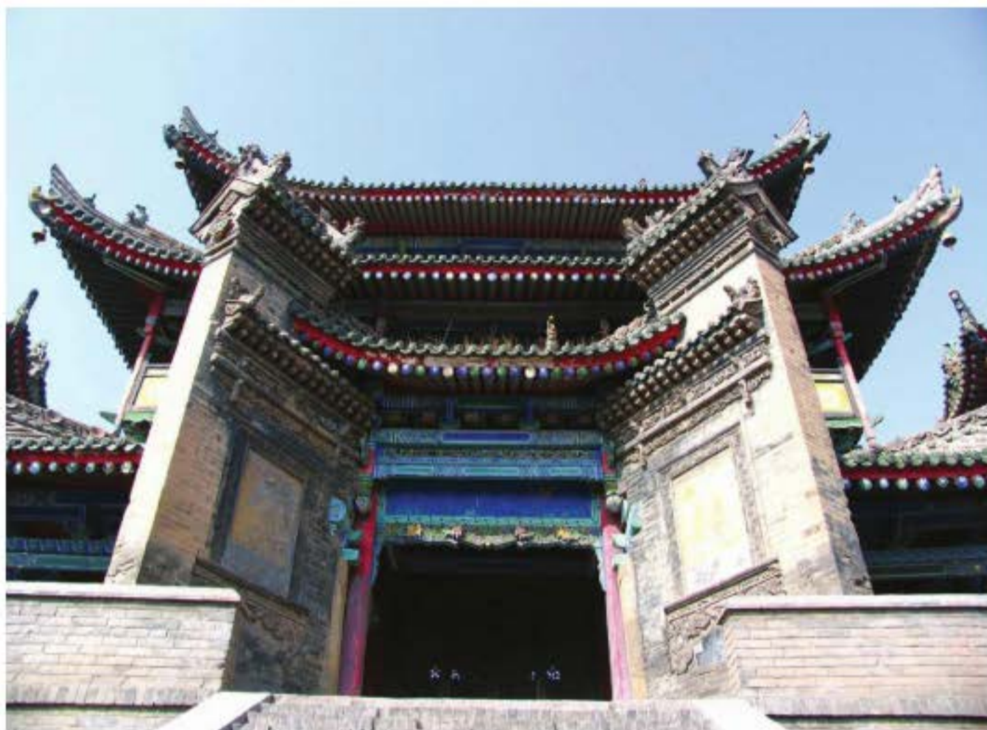
Nhạc Lầu miếu Thành hoàng thời nhà Đường ở huyện Trùng Thành, Thiểm Tây, là nơi diễn kịch tạ ơn.

kì sơ khai. Khuất Nguyên (340 - 278 TCN), một nhà thơ nổi tiếng nước Sở đã để lại rất nhiều thơ ca có liên quan đến nghi lễ thờ cúng. Trong các bài thơ ấy, đặc biệt là bài "Cửu ca" và bài "Cửu chương", xét về mặt nội dung, không chỉ là bài thơ ông sáng tác để giải bày tâm trạng mà còn có thể coi là kịch bản của hoạt động thờ cúng lớn của nước Sở. "Quốc Thương" trong "Cửu ca" thể hiện rõ nét nhất nghi lễ thờ cúng bao gồm các phần mang đậm tính hí kịch ở trong đó, nó là một nghi lễ truy điệu linh hồn những người đã hi sinh vì đất nước. Số lượng lớn ca dao nước Sở lưu truyền rộng rãi ở phía nam đã đại diện cho cách thức cơ bản của nghi lễ thờ cúng với qui mô lớn mà nước Sở ngày xưa thường tổ chức. Thông qua những áng thơ dài này, chúng ta dường như có thể nhìn thấy những màn múa hát tung bừng trong nghi lễ thờ cúng của người cổ đại. Câu thơ mà họ hát có nội dung cốt truyện. Vũ đạo không chỉ là ca hát thuần túy và múa trừu tượng, mà còn bao gồm các động tác mang tính biểu diễn. Những nghi lễ này chính là hình thức ban đầu của hí kịch sau này. Tuy vẫn chưa phải là hình thức nghệ thuật biểu diễn có ý nghĩa kinh điển, nhưng đã có nhân tố mà hí kịch cần trong đó.