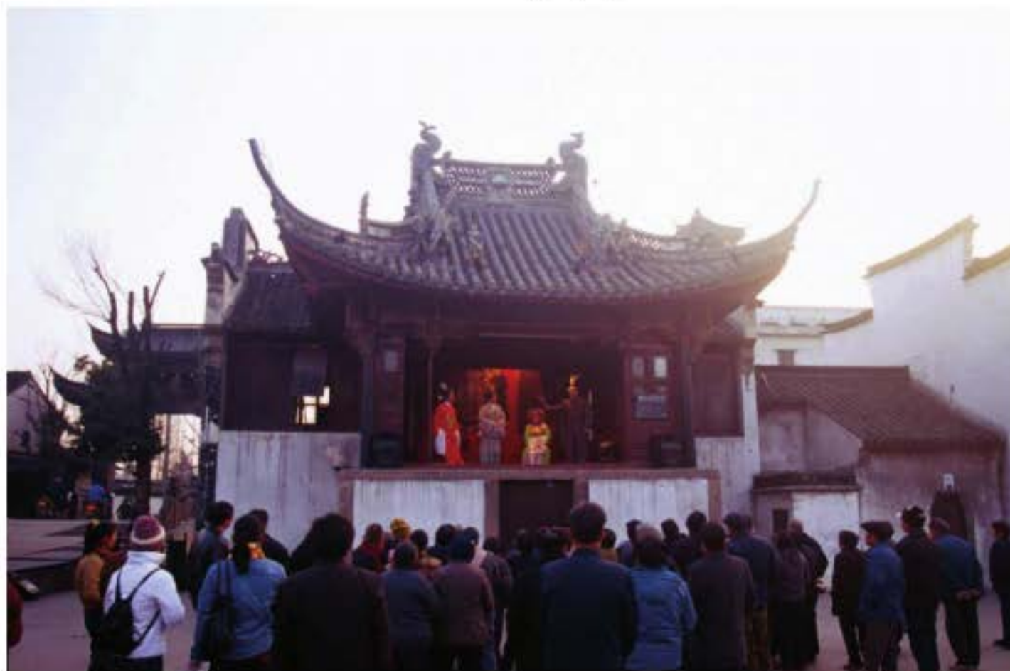
Sân khấu cổ Tu Chân Quan ở Ô Trấn, tỉnh Chiết Giang, xây dựng vào năm 1749. Ở các vùng nông thôn, thành thị của Trung Quốc, sân khấu cổ hoặc hí lầu được xây dựng rộng rãi.

Trước khi điệu Côn Sơn phát triển, ở vùng Giang Chiết thuộc miền nam Trung Quốc cũng đã xuất hiện các điệu địa phương khác với Bắc khúc như điệu Hải Diêm, điệu Dư Diêu và điệu Dục Dương. Xét về mặt vận dụng cung điệu, phong cách hoàn luật cũng như nhạc cụ đệm, chúng đều không cùng hệ thống âm nhạc với Bắc khúc. Việc đào kép vận dụng nó vào hát kịch đã chính thức mở ra thời đại đa dạng của âm nhạc hí kịch Trung Quốc. Điệu Côn Sơn xuất hiện sau này đã che đi ánh hào quang của chúng bằng sự tinh tế điển nhã của mình. Tuy nhiên điệu Côn Sơn không thể thay thế sự tồn tại của chúng, đặc biệt là điệu Dục Dương, vẫn lưu truyền ở miền Nam, đồng thời cùng với côn khúc lưu hành đến các vùng rộng lớn hơn.