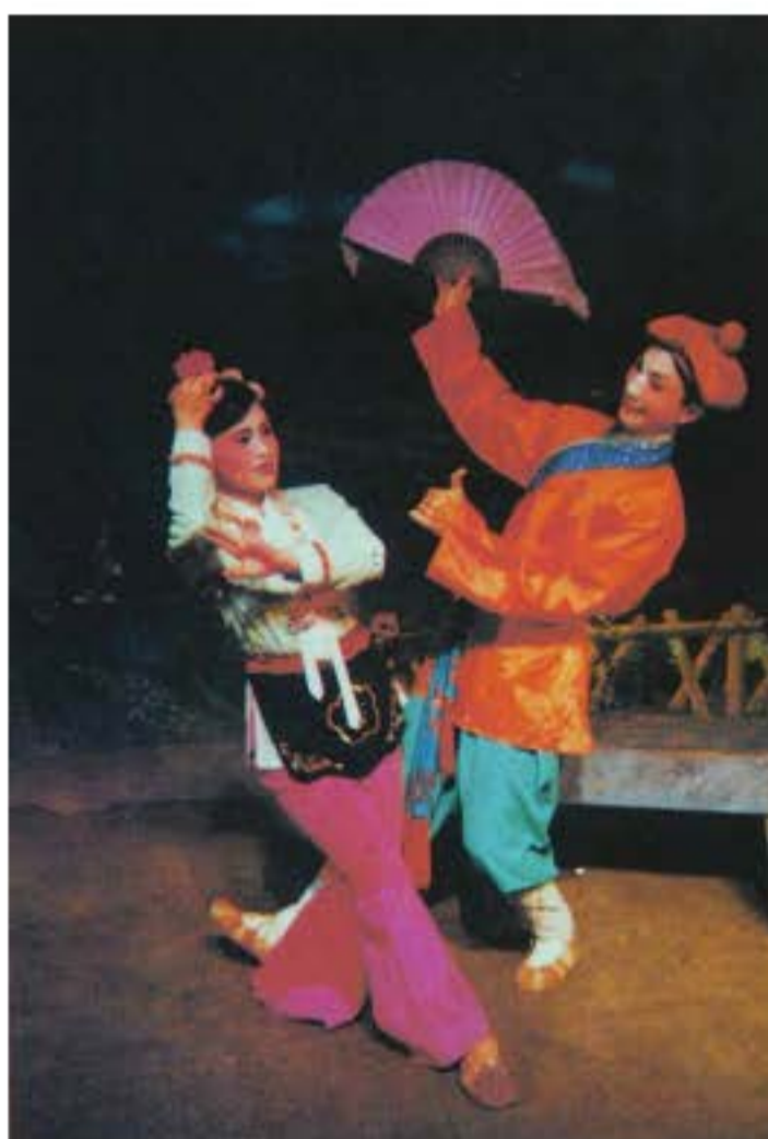
Hoa cổ hí "Mãi tạp hóa" là nhị tiểu kịch tiêu biểu.

Việt kịch có nguồn gốc ở Chiết Giang phát triển nhanh hơn. Việt kịch có nguồn gốc từ hát nói Than hoàng được lưu truyền nhiều năm ở Thặng huyện Chiết Giang và vùng nông thôn quanh đó. Đời Minh Thanh, các nghệ sĩ đã đi khắp các hang cùng ngõ hẻm diễn xướng Than hoàng để mưu sinh. Chính vì vậy nó có truyền thống lâu đời, tiết mục diễn xướng vô cùng phong phú. Các nghệ sĩ đã phát triển nội dung hát nói trong khi biểu diễn, từ xướng thư (hát nói câu chuyện) có nội dung đơn thuần chuyển thành biểu diễn hát và độc thoại, hình thành câu chuyện tương đối hoàn chỉnh và âm nhạc có phong cách thống nhất. Họ có sở trường diễn xướng những câu chuyện