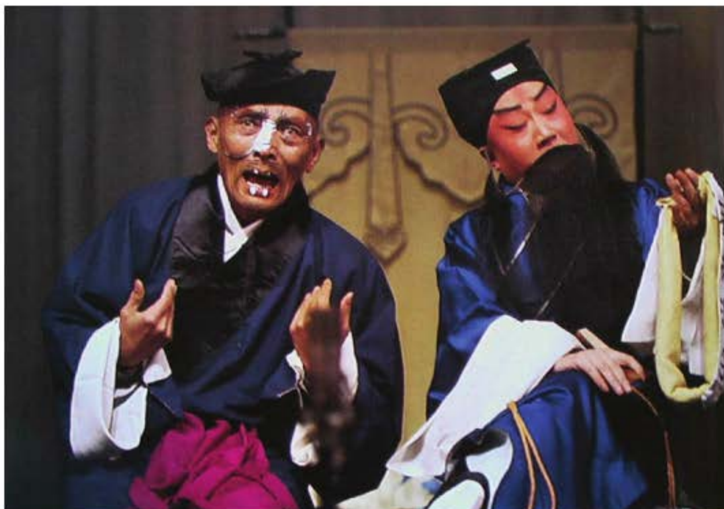
Ảnh kịch Côn khúc "Thập Ngũ Quan".

Truyền kì Côn khúc đời Minh có từ ngữ uyển chuyển, âm nhạc mềm mại, đề tài đa phần là những câu chuyện tình nam nữ, đại diện cho mục đích của các nhà văn đời nhà Minh mê đắm mỹ nữ và âm nhạc, nhưng không đủ để biểu đạt được tâm hồn phóng khoáng của các nhà văn. Sự xuất hiện của Lí Ngọc mang đến sự thay đổi mới cho truyền kì cuối đời Minh, cũng truyền thêm phong cách đa dạng mang khí thế mạnh mẽ cho côn khúc.