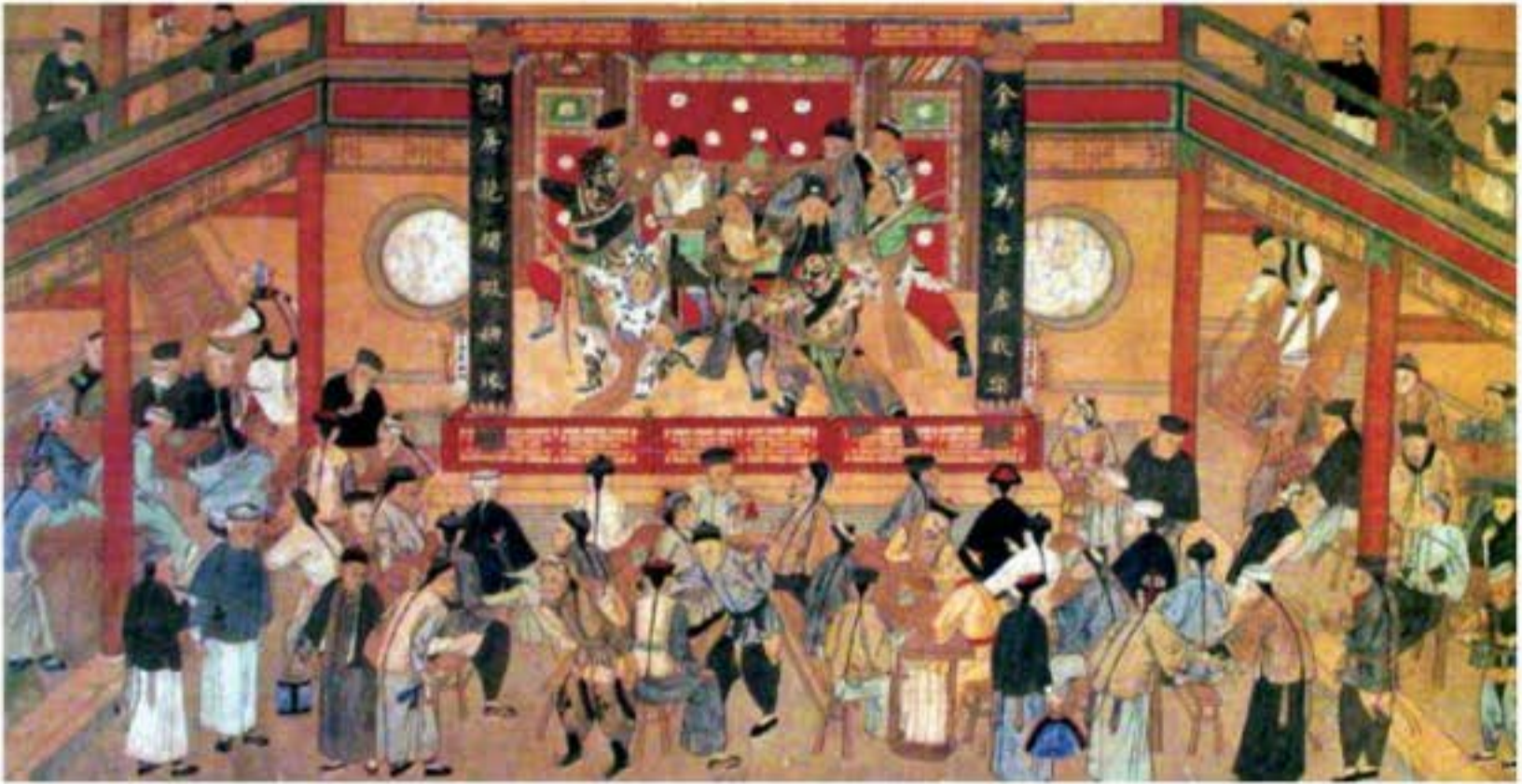
Tranh vẽ cảnh thực: Biểu diễn Kinh kịch trong trà viên đời nhà Thanh. Kinh kịch lúc bấy giờ rất thịnh hành ở thành Bắc Kinh, rất nhiều người yêu thích Kinh kịch tụ tập ở một quán trà nhỏ để xem.

Khoảng năm 1900, những nghệ nhân hát Hoàng Hiếu Hoa Cổ hí (tức Hoa Cổ hí lưu hành ở vùng Hoàng Bản, Hiếu Cảm, tỉnh Hồ Bắc) bắt đầu bước chân vào thành phố Vũ Hán, một thành phố lớn ở trung du sông Trường Giang, biểu diễn các vở kịch tương đối hoàn chỉnh ở một số trà viên cố định ở hương trấn Sa Khẩu, Thủy Khẩu v.v.. Những biểu diễn dân gian vốn bị coi là không ra gì này đã cấm rễ ở Vũ Hán, trong vòng hơn mười năm ngắn ngủi nó đã trở thành một hình thức kịch được quần chúng chào đón, đó chính là Sở kịch.