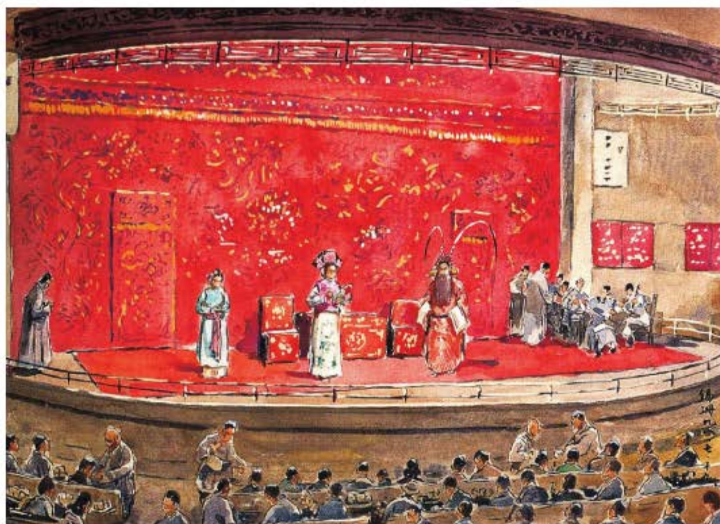
Nhà hát ở Bắc Kinh thời cũ. (Tranh của Thịnh Tích San)

Xét trên nguyên tắc mỹ học nghệ thuật biểu diễn, sân khấu hí kịch truyền thống Trung Quốc cũng có tính hư cấu rất cao. Chỉ với một cái bàn, hai cái ghế và một vài đạo cụ đơn giản, nhưng không gian và hoạt cảnh của kịch truyện đều được giới thiệu đến khán giả thông qua nghệ thuật hư cấu trong