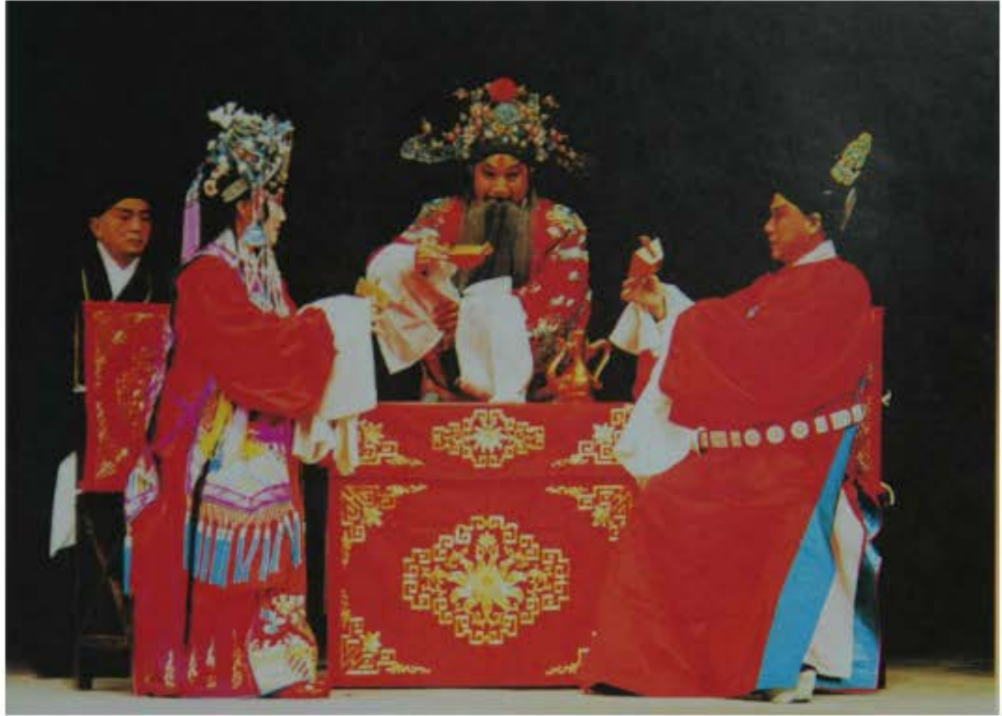
Còn khúc "Tỳ bà kí": Hoa trúc, Thái Bá Giai và Ngưu tiểu thư thành thân. Đoàn còn kịch Tô Châu Giang Tô diễn xuất.