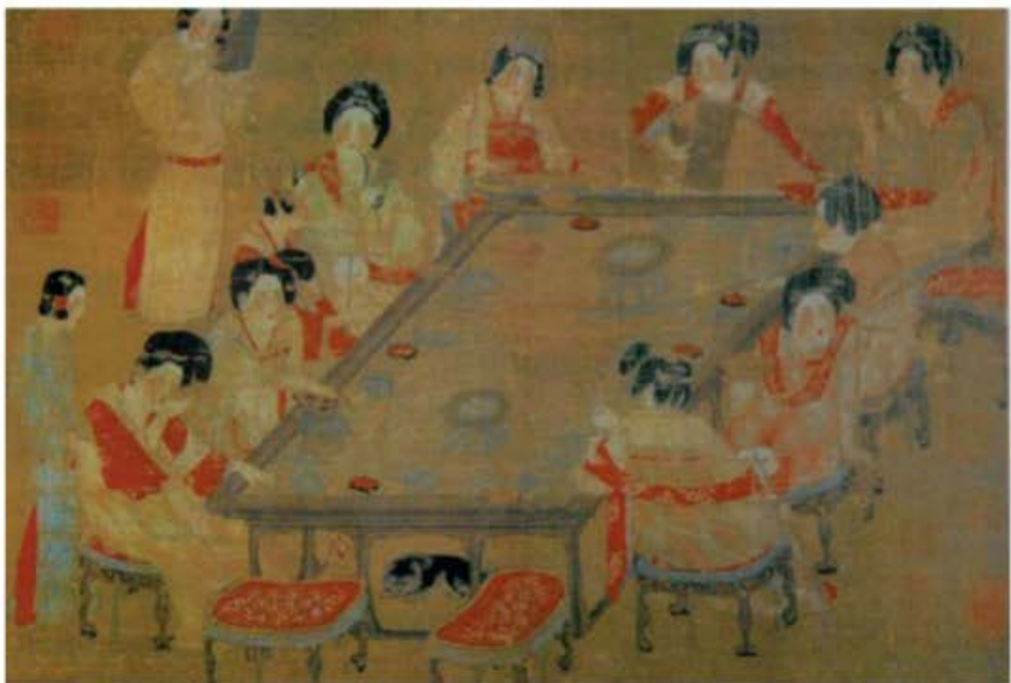
"Cung Nhạc Đổ", vẽ cảnh mỹ nữ trong cung đời nhà Đường dự yến tiệc và nghe tấu nhạc.