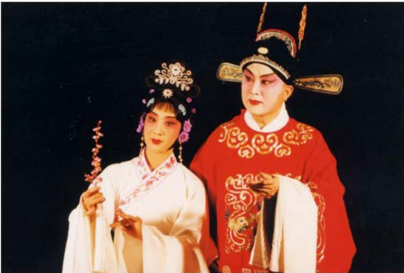
Bức ảnh vở Kinh kịch “Trương Hiệp trạng nguyên”.