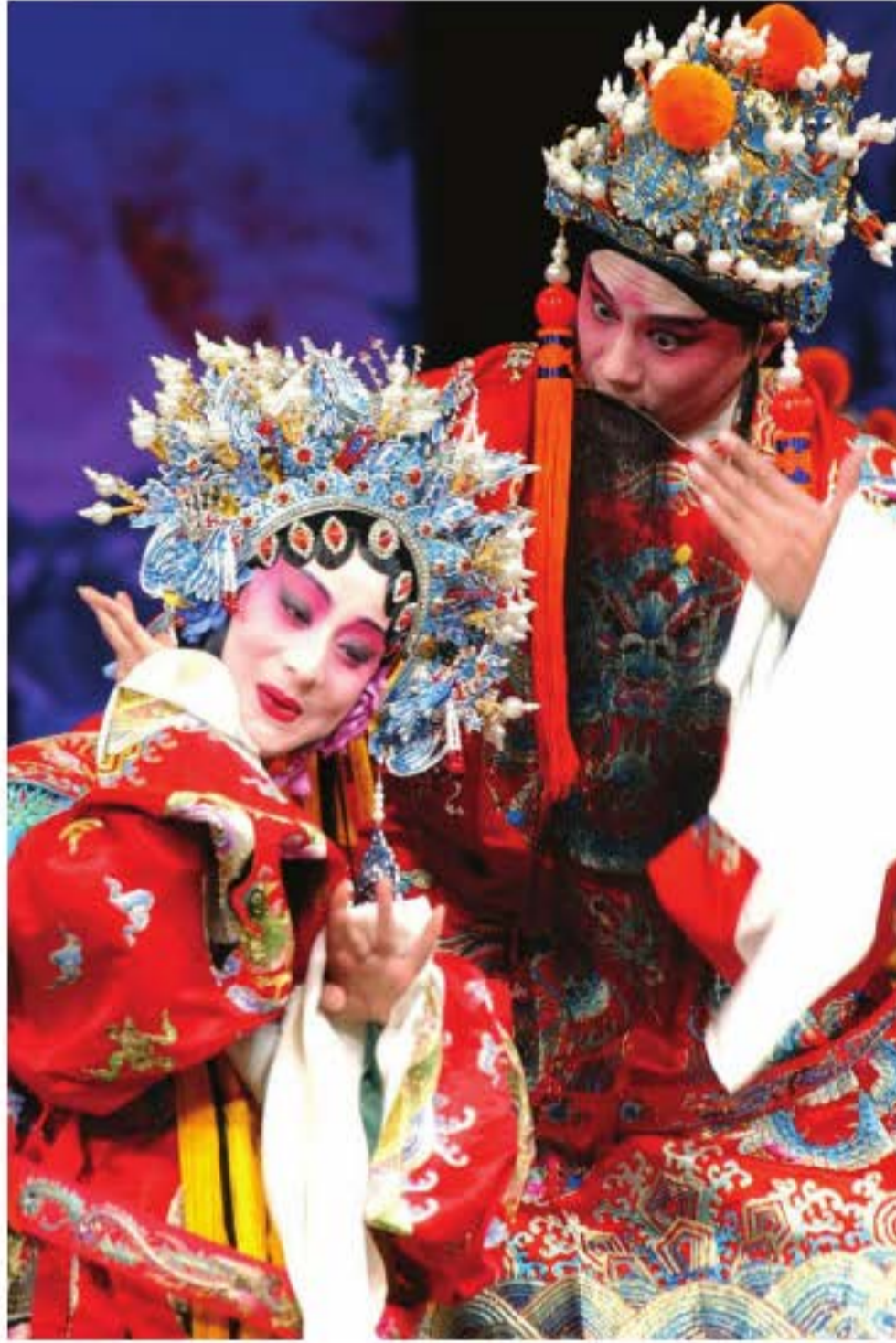
Năm 2004, để kỉ niệm 360 năm ngày sinh của Hồng Ngang, ở Hàng Châu Chiết Giang diễn lại côn khúc "Trường Sinh Điện".

Lí Long Cơ phong Dương Ngọc Hoàn làm phi, vốn đã không đúng phép tắc. Nhưng vì tình riêng mà tín nhiệm kẻ gian thần, lơ là việc nước, dẫn đến sự nổi loạn của An Lộc Sơn. Đường Minh Hoàng vội vã rời đô thành Trường An, dọc đường xảy ra binh biến Mã Ngôi Pha. Tướng lĩnh quân sĩ yêu cầu Đường Minh Hoàng trừ bỏ ái phi Dương Ngọc Hoàn và gian thần Dương Quốc Trung. Không còn cách nào khác, Đường Minh Hoàng ban chết cho Dương Ngọc Hoàn. Tuy nhiên tình yêu của họ vì thế mà thăng hoa, hương hồn Dương Ngọc Hoàn không tan đi, vẫn hàng ngày nhớ nhung Đường Minh Hoàng. Còn Đường Minh Hoàng không còn ý chí, truyền ngôi cho thái tử, quăng đời còn lại chìm sâu trong nỗi mê đắm nhớ nhung ân hận vì đã để mất ái phi Dương Ngọc Hoàn.