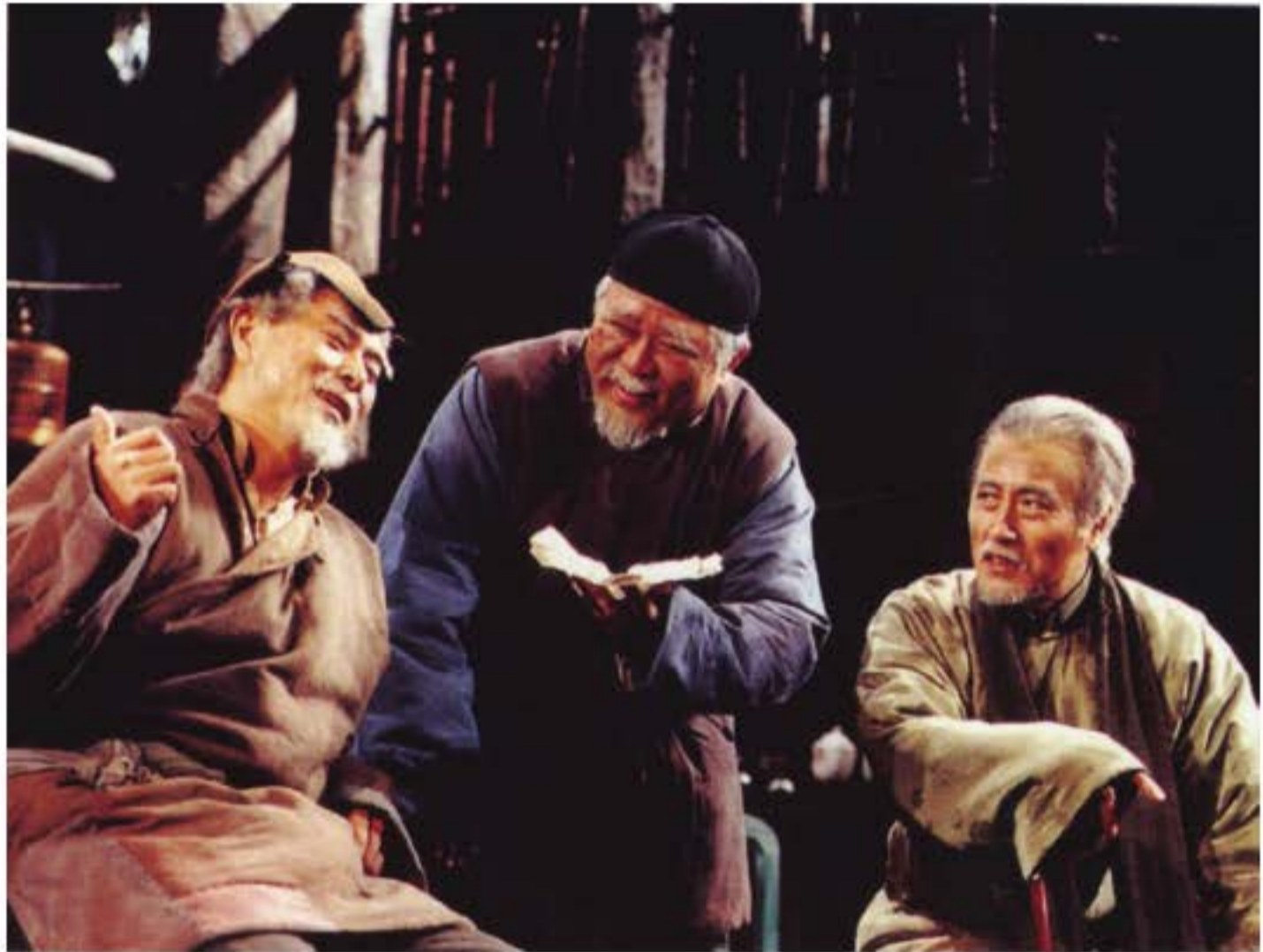
Nhiều năm lại đây, “Trà quán” được biểu diễn liên tục. Ảnh nghệ sĩ Bắc Kinh luyện tập biểu diễn “Trà quán”.

Đối với bộ môn kịch nói mới hình thành, thể hiện đề tài hiện thực không tồn tại những khó khăn về thủ pháp biểu diễn nghệ thuật. Trong quá trình xây dựng đoàn kịch nghệ thuật nhân dân Trung Quốc, sự kết hợp của nhà biên kịch Lão Xá (1899 - 1966) và đạo diễn Tiêu Cúc Ẩn (1905 - 1975) đã tạo nên phong cách dân tộc mới cho nghệ sĩ Bắc Kinh cũng như kịch nói Trung Quốc. Trong quá trình đạo diễn tác phẩm “Long tu câu” của Lão Xá, đặc biệt là “Trà quán”, Tiêu Cúc Ẩn, một người vô cùng sùng bái cách đạo diễn của Stanislavski Konstantin (Nga), mong muốn nghệ sĩ Bắc Kinh trở thành nền tảng thực hiện cơ sở lí luận biểu diễn hí kịch này. Ông yêu cầu diễn viên trong quá trình đọc kịch bản và thể nghiệm nhân vật, phải hình thành trong đầu mình “tâm tượng” của nhân vật trong hí kịch, từ đó đi vào vai diễn. Tiêu Cúc Ẩn là đạo diễn kịch nói Trung Quốc đầu tiên thực sự hình thành được phong cách riêng, chính là ông muốn giới nghệ sĩ Bắc Kinh ngày càng hoàn thiện và định hình phong cách nghệ thuật. “Trà quán” là kiệt tác bất hủ, đặc biệt là màn đầu tiên của nó, trong đoạn kịch ngắn ngủi chưa đầy 10 phút đã khắc họa được mấy chục