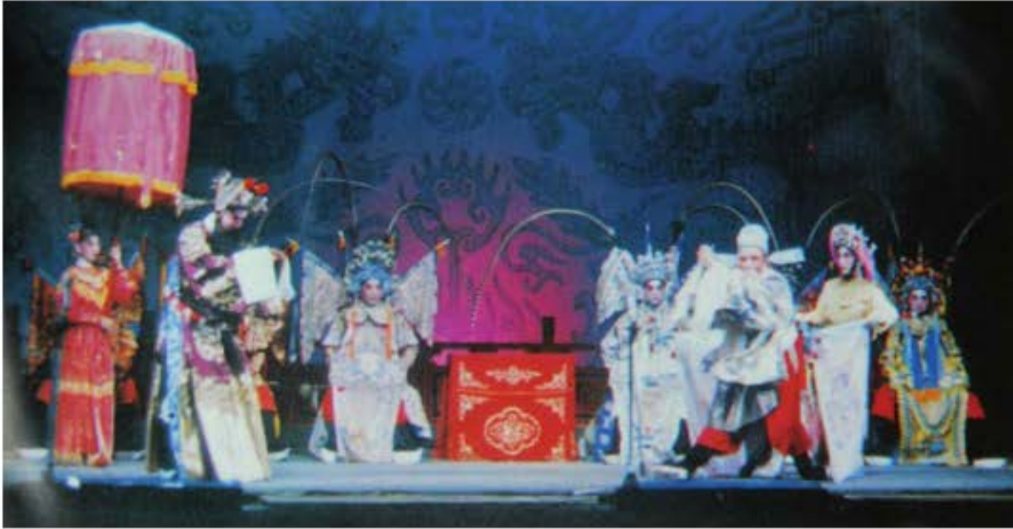
Sân khấu biểu diễn vở Việt kịch nổi tiếng "Lục quốc đại phong tướng", với nhân vật đồng, sân khấu lớn.

thị. Khi cơ cấu xã hội có sự thay đổi lớn, môi trường xã hội và chế độ chính trị đỡ đầu cho các gánh hát và thể chế hí kịch đã không còn phù hợp, thì sự cân nhắc lợi ích thương mại đã thúc đẩy một cách trực tiếp nhất, hiệu quả nhất đến sự thay đổi của quy chế diễn xuất. Sự chuyển hướng lớn của Việt kịch đã thai nghén rất nhiều nhà biểu diễn nghệ thuật nổi tiếng. Cuộc cạnh tranh "Mã Tiết tranh hùng" gần 10 năm giữa Đoàn kịch Giác Tiên Thanh của Tiết Giác Tiên và đoàn kịch Thái Bình của Mã Sư Tăng (1900 - 1964), đã thúc đẩy sự sáng tạo nghệ thuật biên đạo và diễn viên của cả giới Việt Kịch ở vùng Quảng Châu và Hồng Kông, là động lực quan trọng thúc đẩy cả thị trường Việt kịch phát triển vào thời kì giữa và sau dân quốc, đồng thời làm cho Việt kịch chiếm lĩnh thị trường diễn xuất ở khu vực Đông Nam Á, truyền bá tới các nơi trên thế giới theo vết chân người Hoa Lĩnh Nam xuất ngoại.