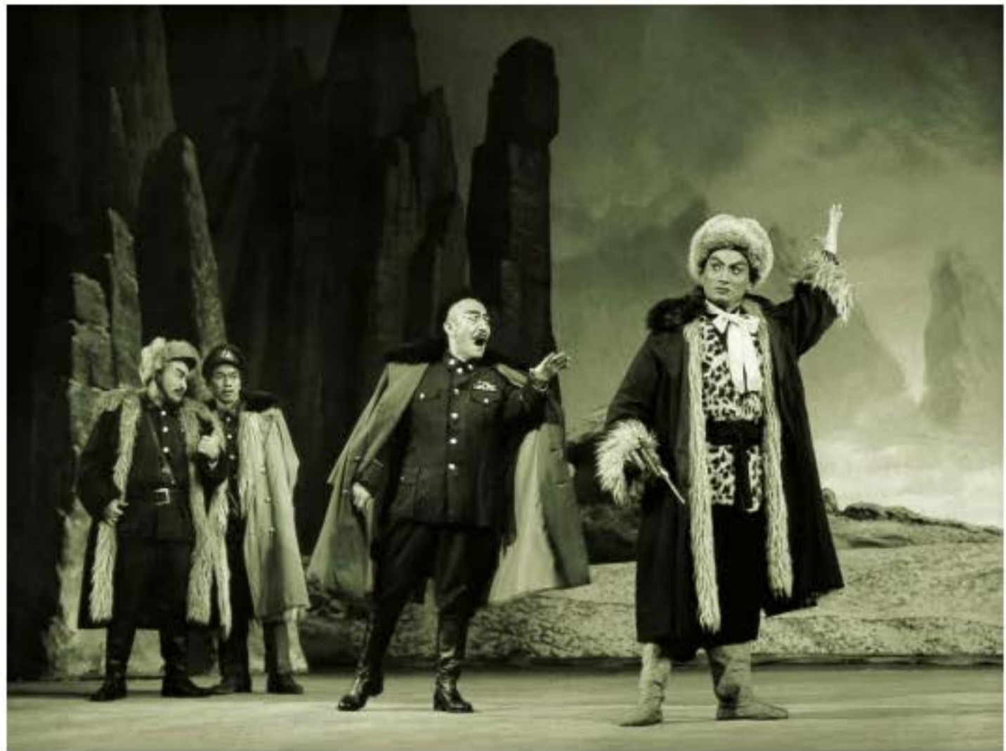
Ảnh kịch Dạng bản hí "Trí thủ uy hổ sơn".

được cải biên từ tiểu thuyết "Lâm hải tuyết nguyên" (rừng thẳm tuyết dày). Cuốn tiểu thuyết lấy đề tài chiến tranh thổ phi vùng đông bắc, cảnh chính câu chuyện xảy ra là cứ điểm của một nhóm xã hội đen sống trong rừng già, nhân vật chính Dương Tử Vinh đóng giả thổ phi thâm nhập nằm vùng. Chiến tranh và gián điệp, nguy hiểm và huyền bí đã tạo nên tính hí kịch mạnh mẽ cho tác phẩm. Các vùng lần lượt xuất hiện nhiều phiên bản kịch sân khấu tự biên, cuối cùng "Trí thủ uy hổ sơn" mà đoàn kinh kịch Thượng Hải cải biên đã được đánh giá cao, đồng thời được coi là bản mẫu để truyền bá, kịch đoàn các vùng trong các nước đều diễn xuất theo phương thức này.