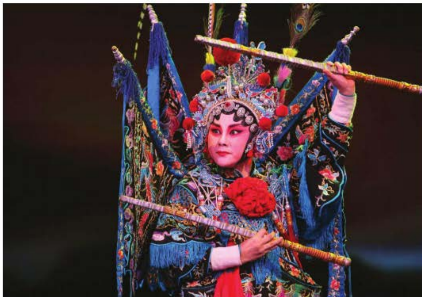
Ảnh chụp Tấn xoang “Dương thất nương”.

“Bản xoang thể” là cách thức âm nhạc thường gặp ở các loại kịch địa phương xuất hiện giữa thời nhà Minh, gọi là “loạn đạn”. Những hình thức kịch mà người ta quen thuộc như Hán kịch, Kinh kịch, Việt kịch (Quảng đông) và Bình kịch, Hoàng Mai kịch v.v.. đều là các loại kịch thuộc “bản xoang thể”. Kết cấu của nó đơn giản, tiết tấu rõ ràng, dễ nắm bắt, dễ truyền miệng, thích hợp với biểu diễn hí kịch dân gian hơn so với thể các làn điệu. “Bản xoang thể” nhìn đơn giản như vậy nhưng chính những câu nhạc đơn giản của nó lại hàm chứa nhiều khả năng thay đổi nhất.