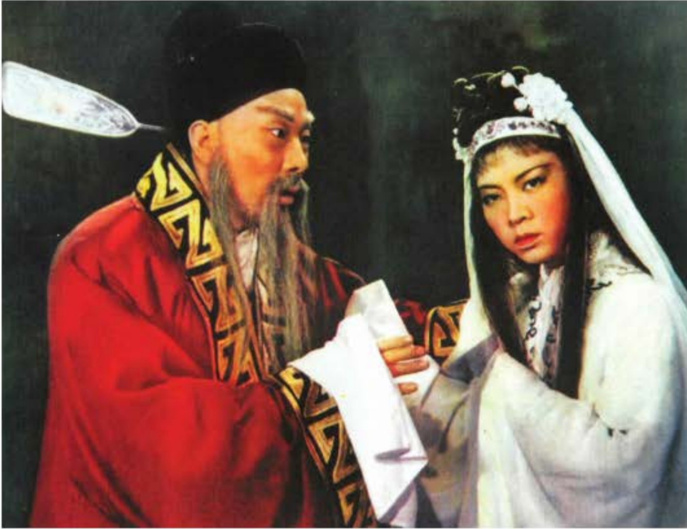
Vở diễn "Đậu Nga oan" bằng điệu Bang tử Bồ Châu, hồn của Đậu Nga gặp cha kể oan ức.

rửa sạch nỗi oan cho cô, trừng phạt hung thủ và viên quan ngu si nọ. Đậu Nga tuy đã được trong sạch nhưng sự mất đi về tính mạng của cô không bao giờ lấy lại được.