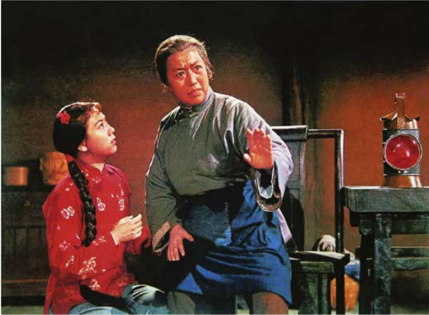
Dạng bản hí “Hong đăng kí”, bà Lí nói với Lí Thiết Hải về “Thống thuyết cách mạng gia sử”.