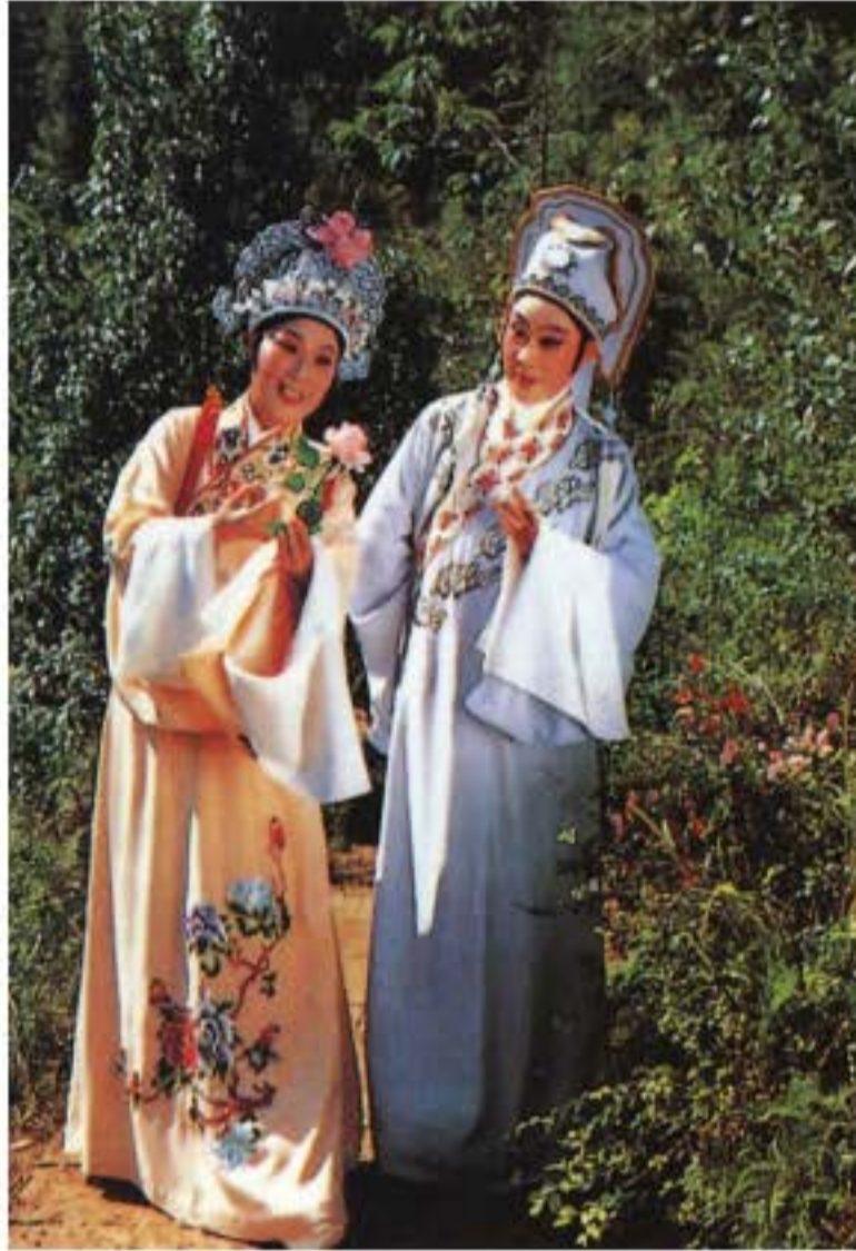
Phim Việt kịch “Lương Sơn Bá và Chúc Anh Đài” (Ảnh chụp).

chính thức hủy bỏ kinh doanh trà nước, kẹo bánh ở nhà hát, thay đổi thói quen hình thành khi biểu diễn ở trà viên vào cuối đời Thanh. Biện pháp “trong sạch hóa sân khấu” này làm cho rất nhiều tập tục có màu sắc riêng trong kịch viện truyền thống bị hủy bỏ, nó chỉ chú ý đến tính nghệ thuật thuần túy trong diễn xuất hí kịch và tính hoàn chỉnh của nghệ thuật biểu diễn sân khấu.