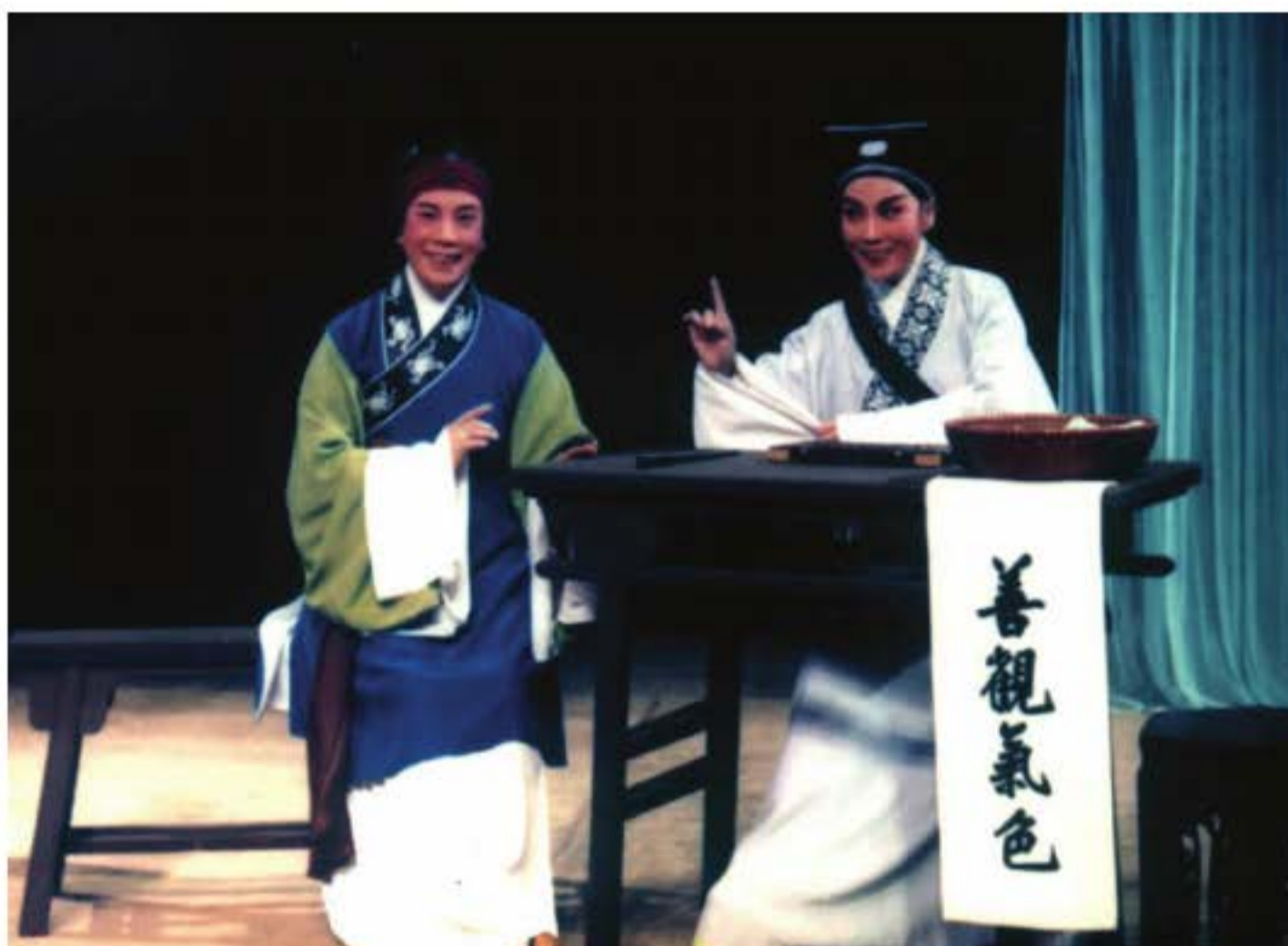
Việt kịch "Hà Văn Tú" màn "Toán mệnh".

Tết xuân năm 1938, Diêu Thủy Quyên (1919 - 1976) dẫn gánh hát Việt kịch do toàn bộ diễn viên nữ lập nên đến Thượng Hải, viết lên một chương mới quan trọng nhất trong lịch sử Việt kịch. Diêu Thủy Quyên tuy là diễn viên nữ, nhưng bà thường hóa trang thành các vai diễn nam. Vào thời đại mà bà lớn lên, các gánh hát Việt kịch toàn bộ là nữ được phát triển mạnh mẽ thành phong trào, đồng thời cũng hình thành phong cách mỹ học độc đáo. Nữ tử Việt kịch đột nhiên có được lực lượng quần chúng lớn ở vùng Giang Chiết Hộ, lớp chính quy đào tạo diễn viên nữ Việt kịch cũng tăng nhanh chóng. Nhạc và lời nữ tử Việt kịch mềm mại uyển chuyển, chứa chan ai oán và bi tình. Nó vừa ảnh hưởng đến thói quen của thị dân Thượng Hải, đồng thời vừa giữ được nét thuần khiết có nguồn gốc vùng nông thôn miền núi, gìn giữ phong cách diễn xướng thanh tân tú lệ của xướng thư dân gian. Việt kịch kế thừa các tác phẩm mà dân gian tích lũy từ trước, vừa có thể dung nạp nhanh để tài bình dân đô thị, vì thế nó thích hợp với khẩu vị của người xem ở Thượng Hải đến từ nhiều vùng khác nhau, đồng thời dần dần thay đổi phong cách, nâng cao nội hàm nghệ thuật theo yêu cầu của lớp thị dân mới trong thành phố.