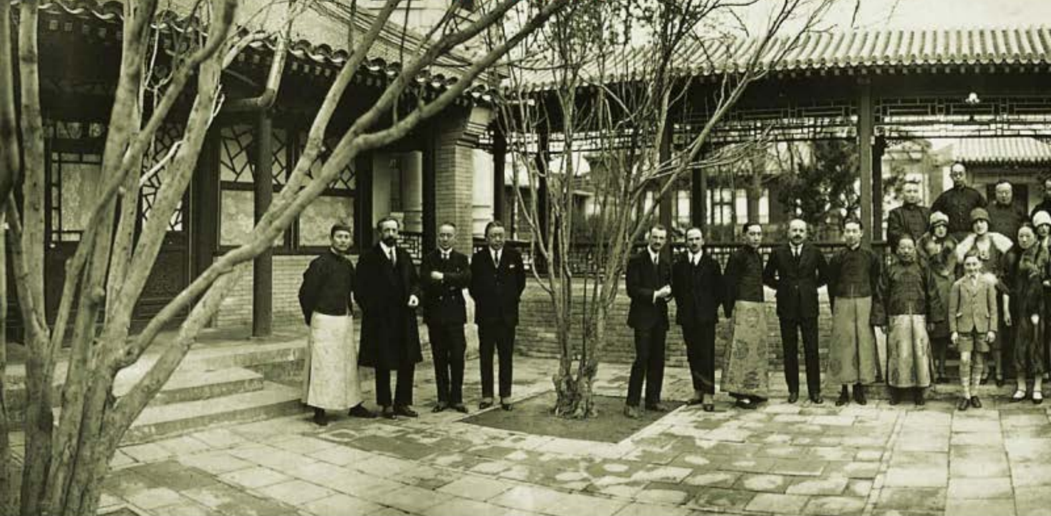
Mai Lan Phương tiếp đón khách Pháp tại nhà riêng của mình ở ngõ Vô Lượng Đại Nhân, khu Đông Thành, Bắc Kinh.