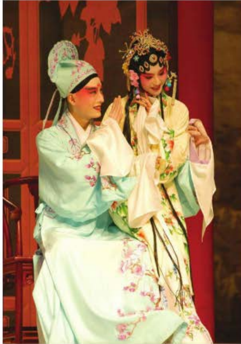
Câu chuyện tình tài tử giai nhân là chủ đề muôn thuở trên sân khấu biểu diễn.

Từ đầu thế kỉ XX, do ảnh hưởng của nghệ thuật biểu diễn phương Tây, nên ở Trung Quốc cũng xuất hiện “kịch nói” không dùng thủ thuật hát. Một