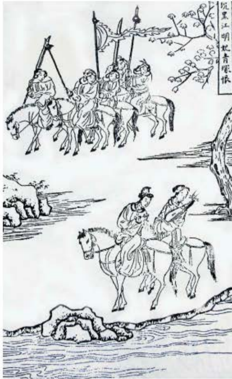
Tranh khắc mộc "Hán Cung Thu": Cảnh Chiêu Quân kết thân ở vùng biên cương xa xôi.

trở thành một trong vô số cung nữ hầu hạ hoàng đế. Vương Chiêu Quân không hối lộ Mao Diên Thọ - một kẻ chuyên vẽ tranh cho các phi tần của hoàng đế, do vậy Mao Diên Thọ cố ý vẽ nàng xấu xí đi, chính vì vậy nàng chưa bao giờ có cơ hội gặp gỡ Hán Nguyên Đế, vị hoàng đế luôn nhìn tranh để chọn phi tần. May mắn thay Chiêu Quân có một tuyệt chiêu là đánh đàn tì bà rất hay. Một hôm Hán Nguyên Đế du ngoạn ở hậu viên trong Hoàng cung đã bị tiếng đàn tì bà của Vương Chiêu Quân mê hoặc, liền cho vời Chiêu Quân đến, sắc đẹp của nàng làm cho Hán Nguyên Đế sửng sốt, vì thế nàng có được sự sủng ái đặc biệt của Nguyên Đế. Thủ đoạn của Mao Diên Thọ bị bại lộ, hẩn trốn