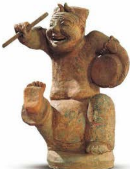
Tượng đánh trống và ca hát đời nhà Hán, miêu tả một anh hề đang biểu diễn hài kịch.

Thời kì nhà Hán, “bách hí” thịnh hành, trong đó bao gồm các hoạt động ca múa, hài kịch, tạp kĩ (bao gồm ảo thuật, hoặc gọi là trò phù thủy) v.v., với hình thức đa dạng nên thường được gọi là “kĩ nghệ”. Các hoạt động biểu diễn kĩ nghệ mà thời kì này còn gọi là “bách hí”, bất luận là ca vũ hay tạp kĩ đều có quan hệ mật thiết với hí kịch.