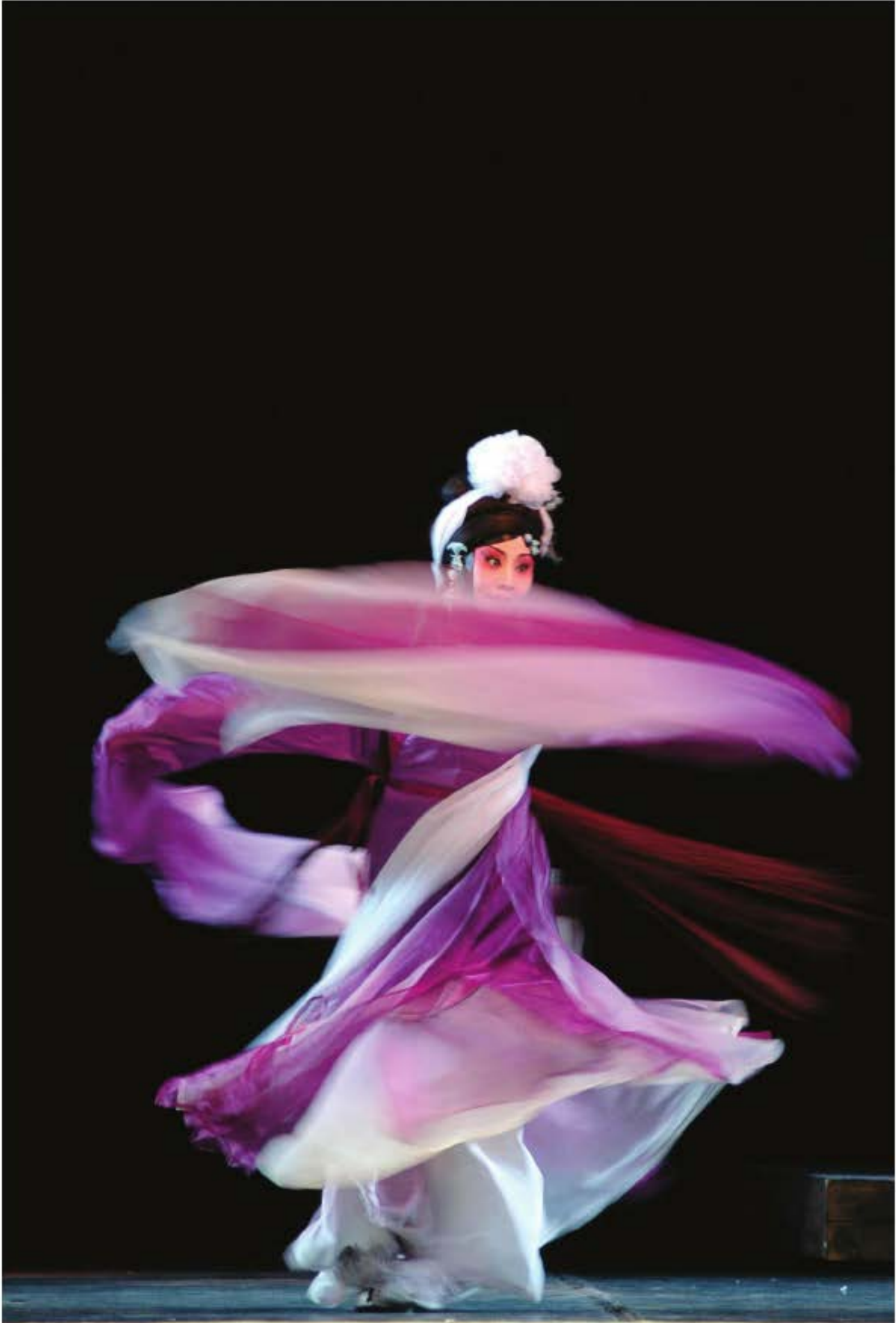
"Đậu Nga oan" của kịch Hà Bắc: Thể hiện một cách tinh tế sự bi phẫn nội tâm Đậu Nga, cũng làm cho sân khấu kịch đạt được hiệu quả kì diệu.