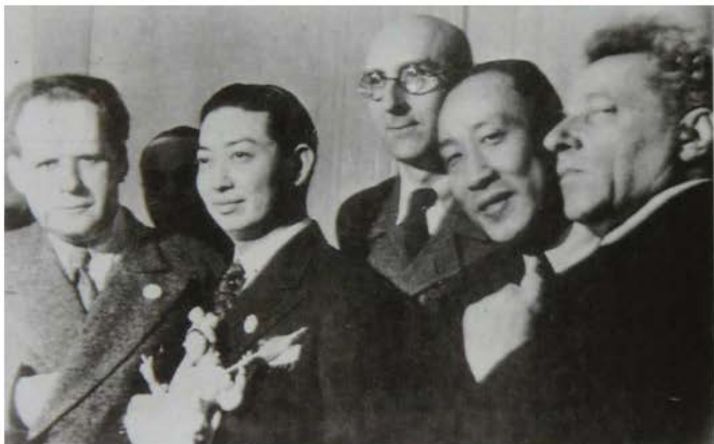
Năm 1935, Mai Lan Phương thăm Liên Xô, Trương Bành Xuân làm cố vấn.

và biểu diễn ở Mĩ là điểm khởi đầu của hí kịch truyền thống Trung Quốc đi vào xã hội thượng lưu Mĩ, đồng thời giao lưu trực tiếp với giới hí kịch Âu Mĩ, do vậy gây được sự chú ý của các học giả, bình luận gia có ảnh hưởng nhất ở Mĩ và giới truyền thông, học viện Pomona Mĩ, đại học Southern California đã lần lượt cấp bằng Tiến sĩ danh dự cho Mai Lan Phương.