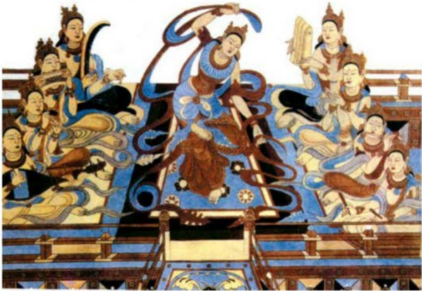
Bích họa Đôn Hoàng, tái hiện một cách nghệ thuật thời kì huy hoàng của nghệ thuật biểu diễn đời nhà Đường.