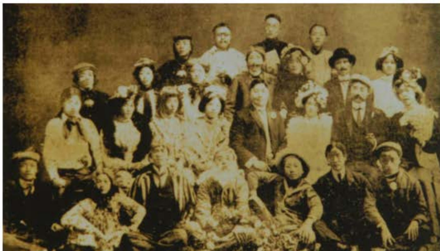
Ảnh kịch: "Năm 1907 Xuân Dương xã diễn xuất kịch "Hắc nô Hu Thiên Lục".

"Thiên Lục" được cải biên từ tiểu thuyết trứ danh của Mi "Túp lều bác Tôm" (của H.B. Stowe). Kể từ đây, Trung Quốc đã có đoàn kịch mới mang tính chuyên nghiệp đầu tiên. Xuân Dương xã liên tục diễn xuất rất nhiều kịch mới, như vở kịch "Tân trà hoa" được cải biên từ tiểu thuyết "Trà Hoa nữ" của Alexandre Dumas người Pháp và các tác phẩm "Nghịệt hải hoa", "Quan trường hiện hình kí", "Thu Cẩn", "Tứ Tích Lân" cải biên từ những tiểu thuyết được lưu hành thời bấy giờ.