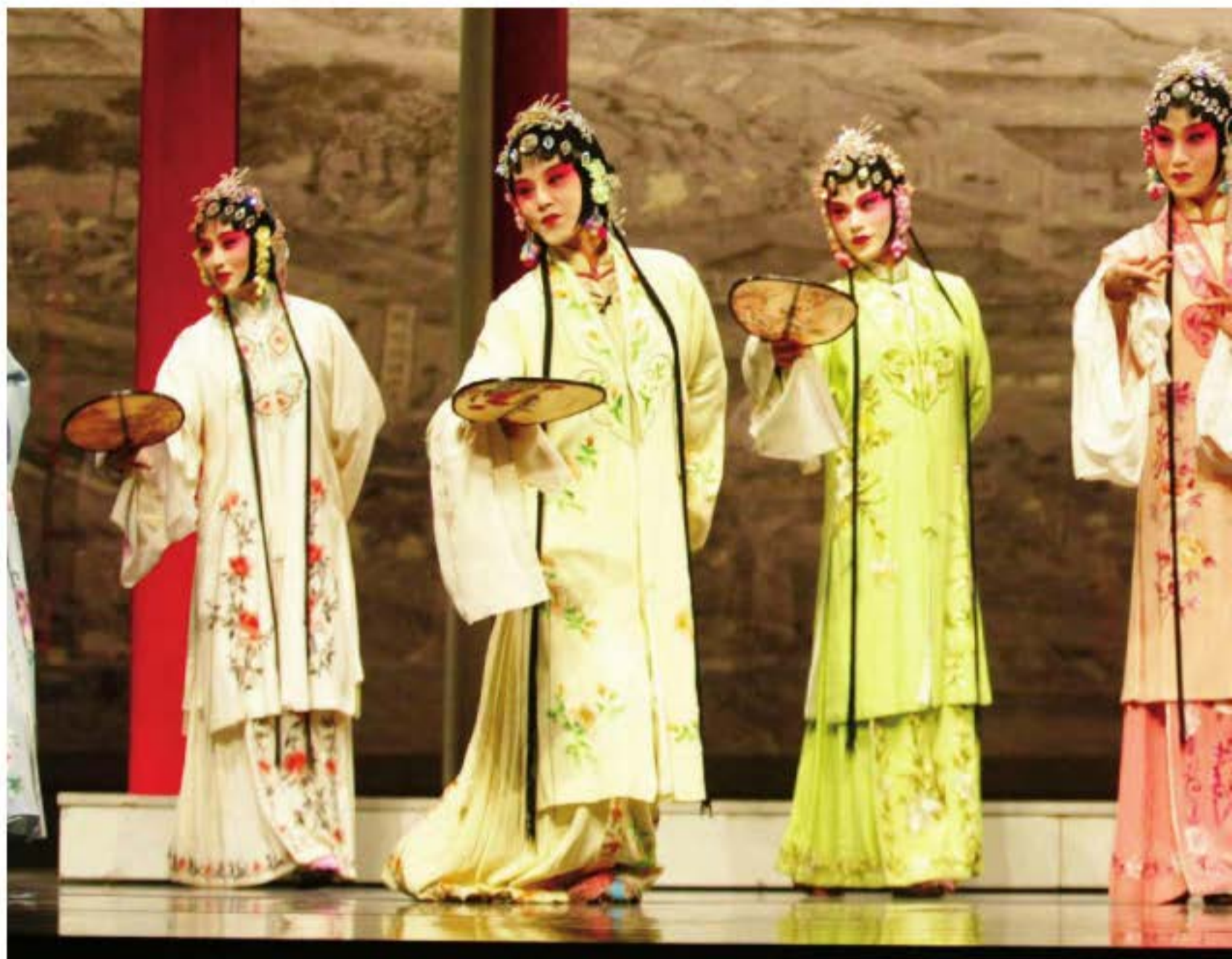
Còn khúc "Đào Hoa Phiến 1699", Đoàn côn kịch Giang Tô biểu diễn.

báo quốc. Sau khi Hầu Phương Vực tòng quân đi xa, Nguyễn Đại Thành ép Lí Hương Quân phải lấy hắn. Lí Hương Quân kiên quyết cự tuyệt, đập đầu tự vẫn, máu bắn vào chiếc quạt thơ khi nàng và Hầu Phương Vực lúc làm quen đã tặng cho nhau. Bạn của Hầu Phương Vực là Dương Long Hữu đã dùng máu trên quạt vẽ một cây hoa đào. Chiếc quạt hoa đào được vẽ bằng máu của Lí Hương Quân, người dùng cái chết để giữ sự trong sạch, đã trở thành vật tượng trưng cho sự kiên nghị. Triều đại Nam Minh cuối cùng bị diệt vong, Lí Hương Quân xuất gia, Hầu Phương Vực khổ công tìm Lí Hương Quân nhưng không có kết quả, cuối cùng cũng xuất gia học đạo. Tuy hai người gặp nhau khi đã thoát khỏi bụi trần nhưng tình yêu dường như vẫn quanh quẩn đâu đây.