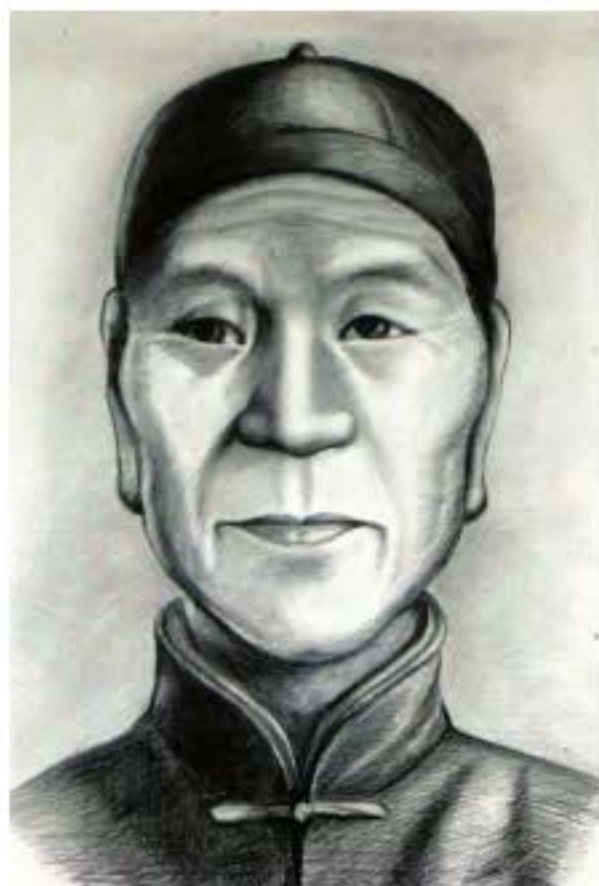
Tranh vẽ chân dung Thành Triệu Tài.

là “Lạc tử” hoặc “Bằng bằng”. Đây vốn là các bài hát điệu múa và vở kịch hát ngắn được dân chúng địa phương vô cùng yêu thích, thường có nghệ sĩ dân gian thủ đưa nó lên sân khấu biểu diễn. Khát vọng đưa “Lạc tử” lên biểu diễn trên sân khấu đã làm cho nghệ sĩ “Lạc tử” dần dần tập hợp thành nhiều gánh hát vào những năm đầu thế kỉ XX, phần lớn các gánh hát đều do bảy tám người tập hợp lại. Họ lần lượt tiến vào Thiên Tân, do ở trong khu vực trực thuộc triều đình nhà Thanh quản lí “Lạc tử” hết sức nghiêm ngặt, nên họ chạy ra vùng giáp ranh hoặc biểu diễn ở quán trà ở vùng “tam bất quản”, hoặc chấp nhận biểu diễn ở sân khấu được quây ngoài trời. Quá trình biểu diễn đi biểu diễn lại đã làm phong phú thêm nội dung và tình tiết