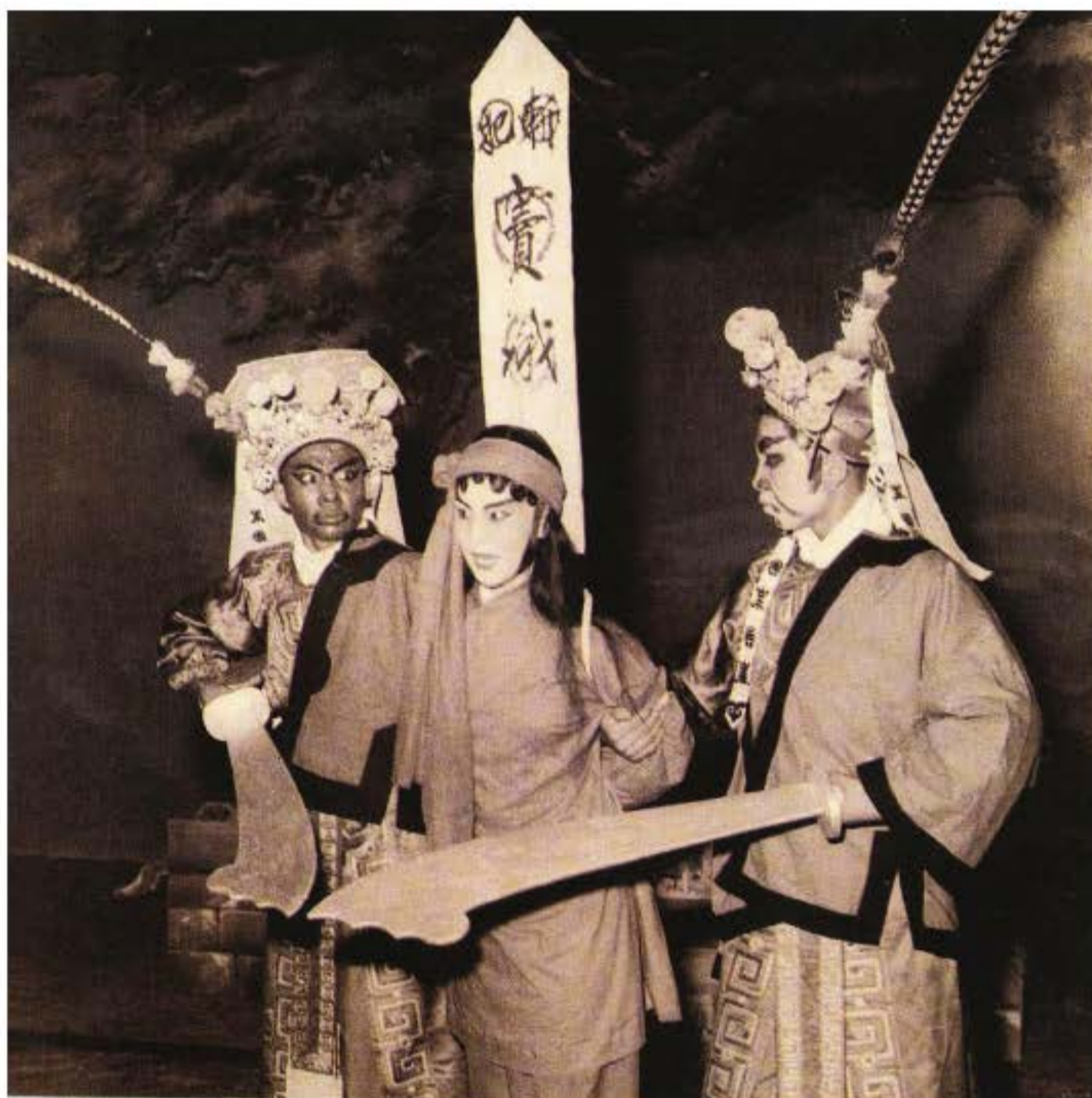
Diễn vở "Đậu Nga oan" bằng làn điệu Tấn: Đậu Nga oan ức bị giải ra pháp trường.

nhìn thấy mẹ chồng bị dùng hình liễn nhận tội thay, nói mình hạ độc giết chết bố của Trương Lư Nhi. Thế là Đậu Nga bị xử trảm theo luật, ở pháp trường cô nói lên nỗi oan ức của mình, thề nguyện ba điều: máu phun lựa trắng, tuyết rơi tháng sáu, hạn hán ba năm. Đậu Nga tin rằng ông trời sẽ thấu hiểu được nỗi oan ức của mình, đồng thời làm chứng cho tấm lòng trong sạch của nàng. Quả nhiên, trời đất cảm động bởi Đậu Nga, sau khi cô chết đi, ba nguyện ước đều đã thành sự thực. Bố cô Đậu Thiên Chương đã đỗ cao trong kì thi, được triều đình trọng dụng, được cử đi điều tra các vụ án của các vùng. Đậu Thiên Chương đi tuần sát đến vùng Sở Châu ba năm hạn hán không mưa. Trong đêm linh hồn oan ức của Đậu Nga tìm về gặp ông, thổn thức kể oan ức mà cô đã phải chịu. Đậu Thiên Chương đã