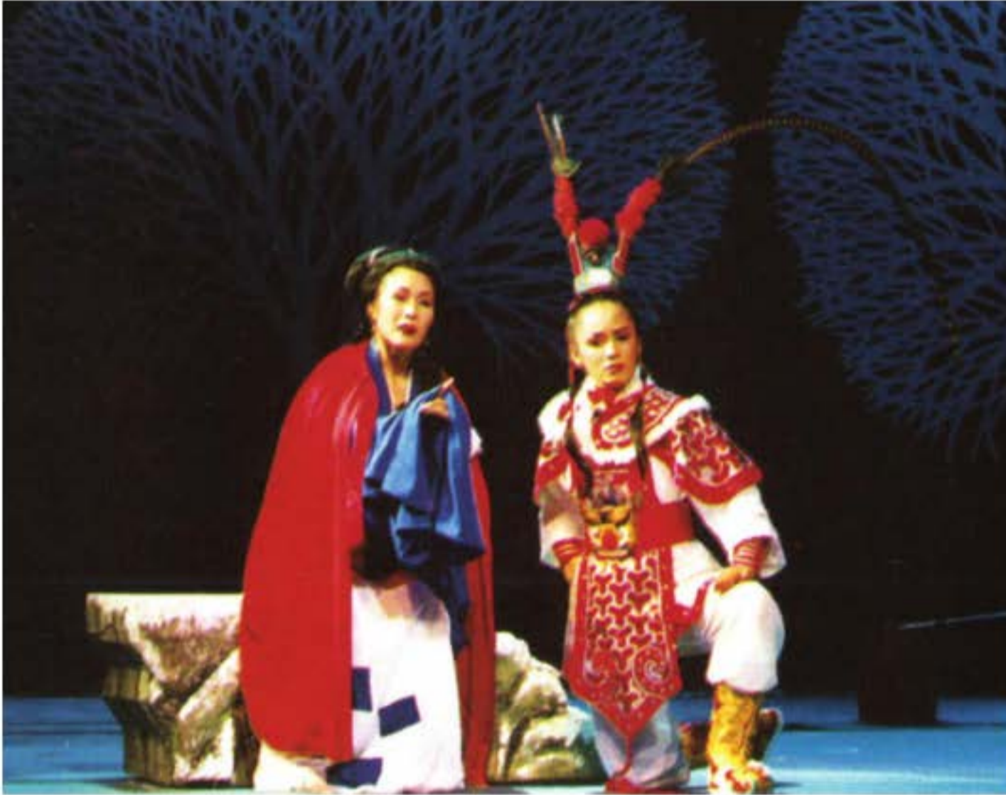
Việt kịch "Bạch thỏ kí", tam nương và con trai trùng phùng sau 15 năm xa cách. Kịch do Đoàn Việt kịch Ôn Châu tỉnh Chiết Giang diễn xuất.

Bằng, người chỉ có chút sinh vật hèn mọn. Sau khi kết hôn, chàng thư sinh Vương Thập Bằng vào kinh thi, đỗ đạt cao, thừa tướng Muôn Kì ép chàng lấy con gái mình, Vương Thập Bằng kiên quyết cự tuyệt, vì thế chàng đã bị trừng phạt. Tôn Nhữ Quyển đã sửa thư mà Vương Thập Bằng gửi cho Tiên Ngọc Liên thành thư từ hôn, đồng thời thông đồng với kế mẫu của Ngọc Liên ép nàng tái giá. Tiên Ngọc Liên quyết không nghe theo, nàng nhảy xuống sông tự vẫn, may nhờ có Tuần phủ Phúc Kiến là Tiên Tái Hoà cứu sống, và nhận nàng làm con nuôi. Tiên Ngọc Liên nghe tin tướng Vương Thập Bằng đã chết. Vương Thập Bằng cũng được tin Ngọc Liên đã từ bỏ cõi nhân gian. Hai người vô cùng thương xót nhau, cuối cùng họ đã gặp nhau khi cả hai đi lễ bên bờ sông. Cả hai đoàn tụ trong niềm vui hạnh phúc vô bờ.