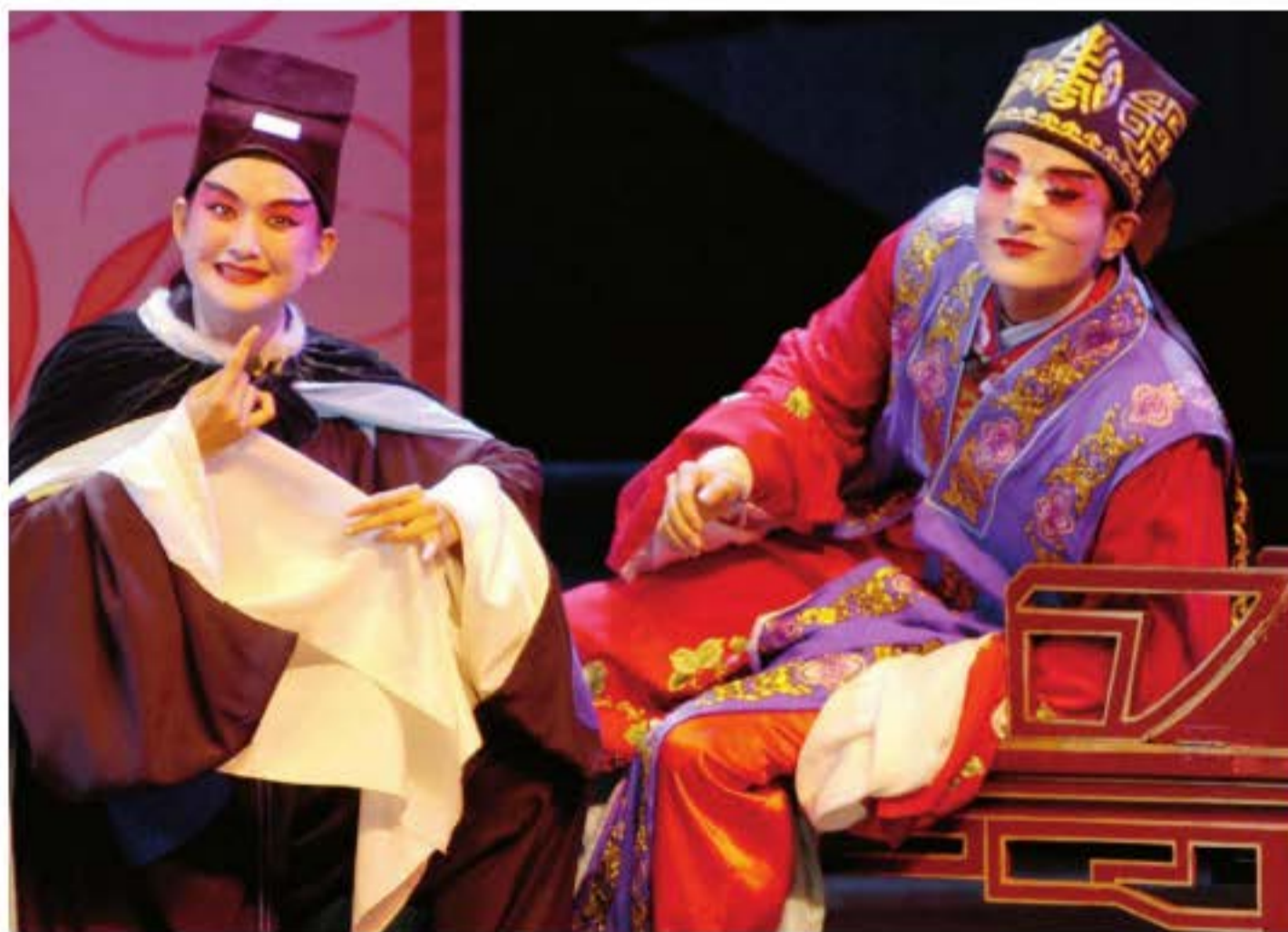
Còn khúc “Sát cầu kí”, Đoàn kịch côn khúc Vĩnh Gia tỉnh Chiết Giang biểu diễn.

“Sát cầu kí” cũng có đề tài giống như tạp kịch đời Nguyên “Sát cầu khuyển phu”, kể về Tôn Hoa, một chàng công tử con nhà giàu có kết giao với Liễu Long Khanh, Hồ Tử Truyền, đều là những kẻ vô lại ở chốn chợ búa. Tôn Hoa đã đuổi người em Tôn Vinh ra khỏi nhà. Vợ của Tôn Hoa, là Dương Nguyệt Trinh hết lòng khuyên bảo nhưng Tôn Hoa vẫn không nghe ra. Dương Nguyệt Trinh liền giết một con chó, dùng bao gói cẩn thận rồi đặt ngoài cửa nhà. Tôn Hoa nửa đêm về nhà ngỡ rằng xác người chết, vô cùng hoảng sợ, để trốn tránh sự truy đuổi của quan phủ, đã nhờ đến sự giúp đỡ của Liễu Long Khanh, Hồ Tử Truyền. Khi Tôn Hoa gặp họa, những người bạn