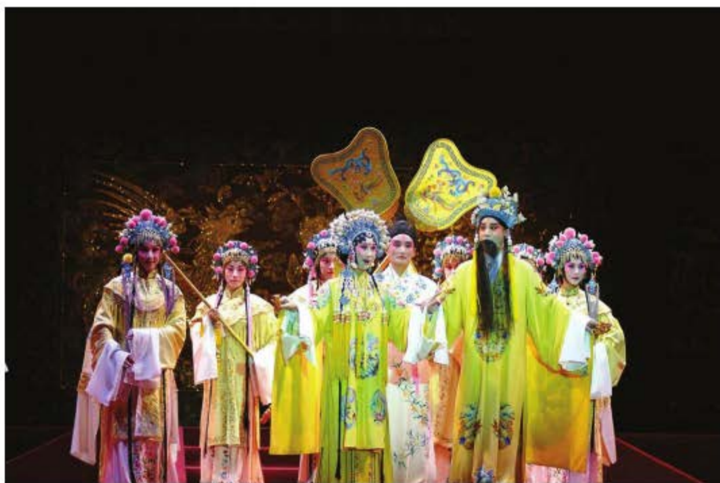
Còn khúc “Trường Sinh Điện”, đoàn còn kịch Tô Châu biểu diễn.

Trọng tâm của “Trường Sinh Điện” xoay quanh chuyện tình cảm, li tán của Đường Minh Hoàng Lí Long Cơ và quý phi Dương Ngọc Hoàn. Nó không hề úp mở việc Lí Long Cơ quá đỗi sủng ái Dương Ngọc Hoàn mà mang lại nguy nan cho đất nước. Phần đầu của vở kịch, tác giả dùng không ít từ ngữ để miêu tả cảnh ân ái của Lí Long Cơ và Dương Ngọc Hoàn, bao gồm cả việc Lí Long Cơ do cứng chiều Dương Ngọc Hoàn mà để mặc cho huynh trưởng của Dương Ngọc Hoàn là Dương Quốc Trung lạm hành. Trong màn “Tiến quả”, Lí Long Cơ hạ lệnh dùng ngựa chạy nhanh suốt ngày đêm xuống miền nam tìm quả vải để cống tiến cho Dương Ngọc Hoàn, món trái cây mà nàng yêu thích. Điều này đã phản ánh trực tiếp được sự oán hận của dân chúng.