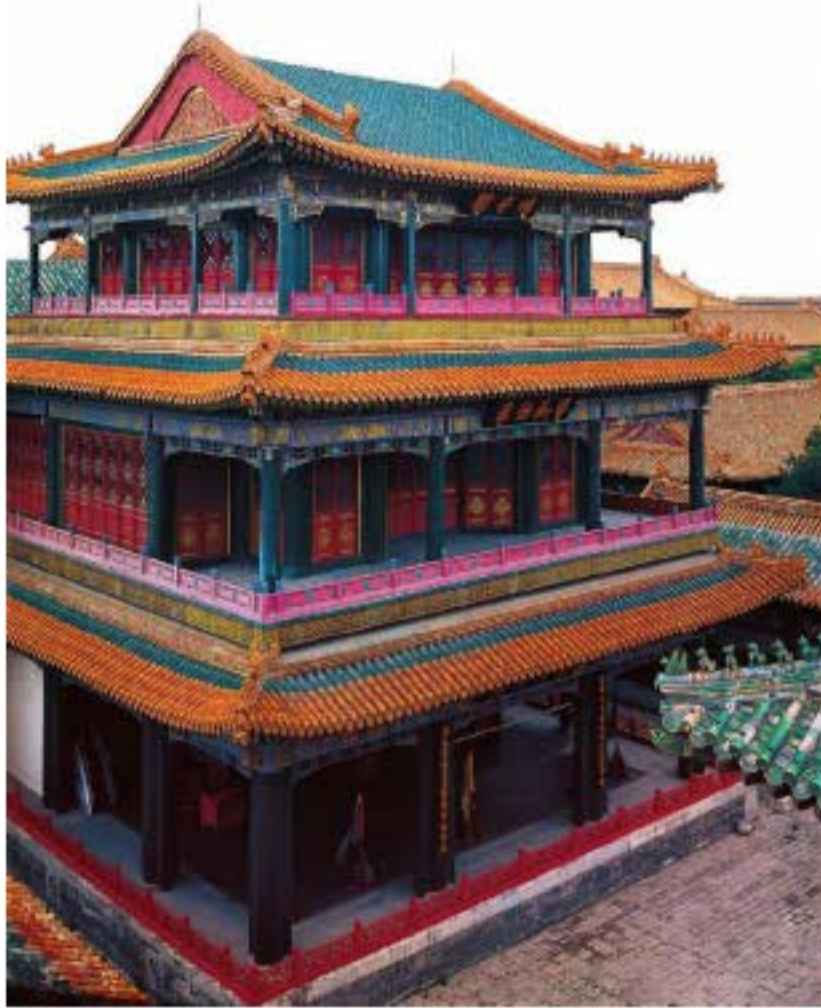
Sân khấu lớn Sương Âm Các trong Cố Cung. Xem kịch là hoạt động giải trí chủ yếu của Hoàng đế, phi tần trong cung vào thời nhà Thanh. Mỗi dịp lễ tết hoặc mừng thọ vua và hoàng hậu đều tổ chức diễn kịch trong cung để chúc mừng.