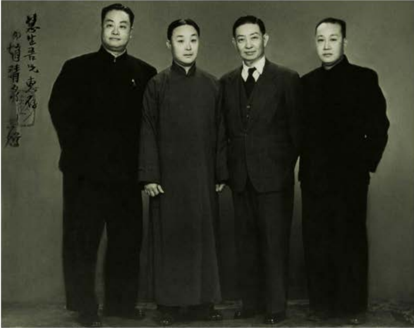
Ảnh chụp "Tứ đại danh đán" Kinh kịch năm 1949, từ trái sang phải lần lượt là Tuân Huệ Sinh, Thượng Tiếu Vân, Mai Lan Phương, Trinh Nghiênn Thu.

Mai Lan Phương là bậc thầy biểu diễn Kinh kịch xuất hiện vào thời Dân Quốc và có ảnh hưởng tầm cỡ thế giới. Mai Lan Phương sinh ra trong một gia đình có truyền thống Kinh kịch ở Bắc Kinh, mười tuổi đã biểu diễn "Thiên Tiên phối" ở sân khấu lâu Quảng Hòa của Bắc Kinh, và nhanh chóng nổi tiếng. Năm 1913, ông đến Thượng Hải biểu diễn lần đầu tiên, vang dội cả một vùng Giang Nam. Năm sau đó lại đến Thượng Hải, biểu diễn vở kịch truyền thống nổi tiếng "Quý phi say rượu", biểu diễn liên tục 34 ngày. Một thời gian sau đó, ông tổng hợp hình thức biểu diễn các nhân vật như thanh y, hoa đán, đao mã đán v.v.. của Kinh kịch truyền thống, hình thành nét đặc sắc riêng về giọng hát, độc thoại, âm nhạc, trang phục của đán giác (vai đán) Kinh kịch, đặc biệt còn sáng tạo ra giọng hát hoa mỹ lưu loát, hình thành phong cách "Mai phái" (trường phái Mai Lan Phương) độc đáo.