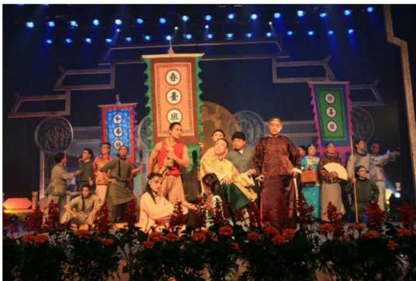
Kinh kịch "Gánh hát Huy ban vào kinh" tái hiện cảnh rầm rộ của "tứ đại huy ban" năm đó tiến vào kinh kì. Biểu diễn của Kịch viện Huy kinh, tỉnh An Huy.

điệu pha trộn Côn khúc, Bang tử và Nhị hoàng. Do tính phong phú của hình thức biểu diễn, các tiết mục này dần dần có chỗ đứng trong thị trường biểu diễn ở kinh thành, làm cho hoạt động biểu diễn ở thành phố Bắc Kinh, nơi tập trung nhiều quan lại, văn nhân và dòng dõi quý tộc hoàng thân ngày càng sôi động. Càng bởi vì nghệ nhân Hán điệu (hình thức hí kịch chủ yếu lưu hành ở Hồ Bắc và lưu vực Trường Giang, Hán Thủy) vào kinh thành đấu quân cho gánh hát Huy ban. "Huy ban" và "Hán điệu" hợp nhau lại càng tăng thêm sức mạnh biểu diễn kinh kịch, một hình thức biểu diễn độc đáo đã được hình thành, đồng thời rất nhanh chóng đã trở thành một trong những loại hình kịch được yêu thích nhất. Nội dung đề tài, phong cách diễn xướng và chế độ diễn xuất độc đáo của kinh kịch đều phù hợp với quan điểm văn hóa cơ bản ở kinh thành, do vậy nó có thể biểu lộ được nét tinh hoa trong thành Bắc Kinh, nơi có rất nhiều hình thức kịch cùng tồn tại.