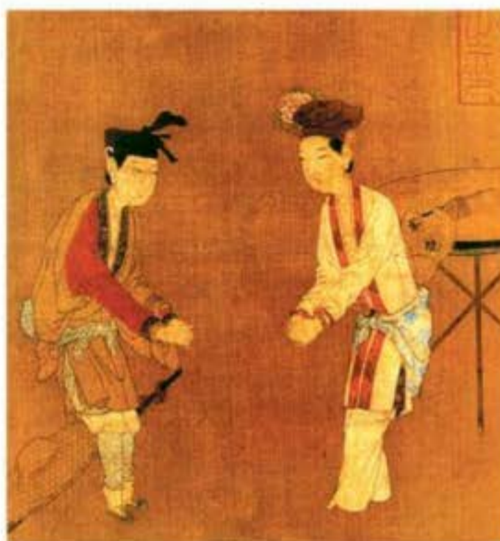
Tranh lụa tạp kịch đời Tống. Trong tranh là hai diễn viên nữ đang đóng vai nam. Loại hình diễn xuất nữ chuyên đóng vai nam gọi là “Tạp kịch đệ tử”.

Âm nhạc “Tây Dương Kí chư cung điệu” phong phú, dùng 14 loại cung điệu khác nhau, có khoảng 150 làn điệu cơ bản. Thời kì đời Tày - Đường đã xuất hiện