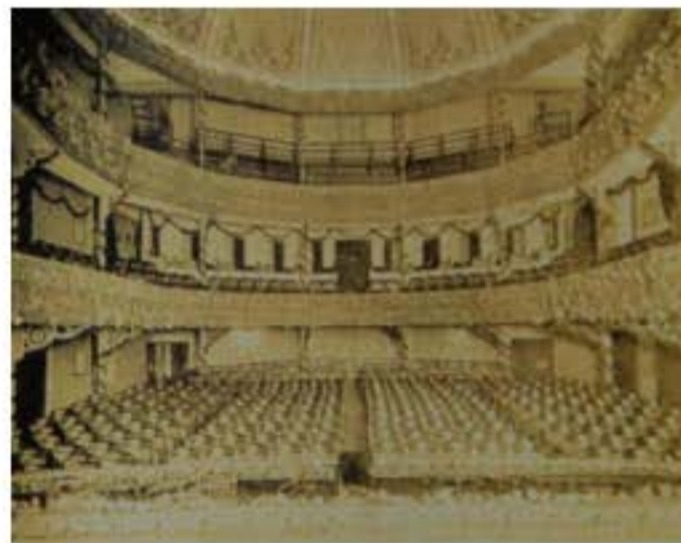
Cảnh bên trong kịch viện Lan Tâm.