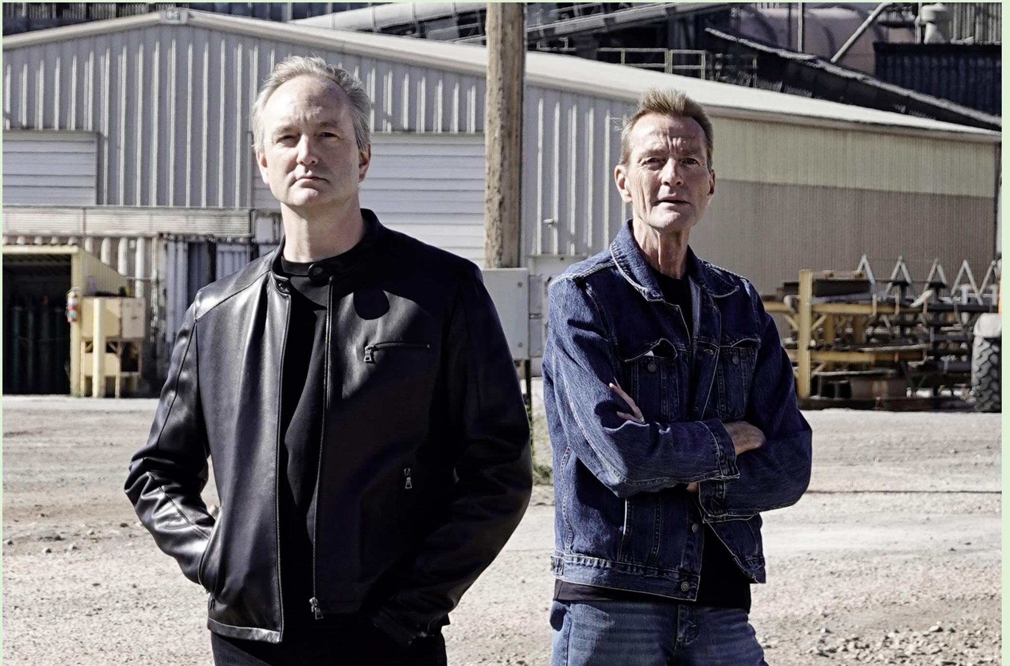
Andrew Child and Lee Child